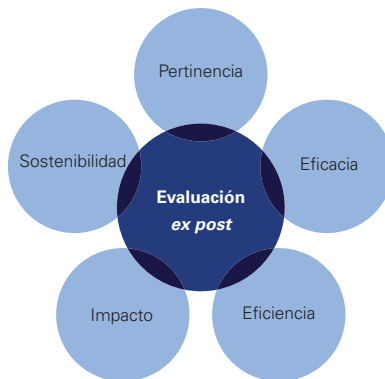
Figura 1. Criterios de evaluación ex post propuestos por el SNIP

En el contexto del Sistema Nacional de Inversión Pública (SNIP) 1 , la evaluación ex post se define como una evaluación objetiva y sistemática sobre un proyecto concluido cuya finalidad es determinar la pertinencia, eficiencia, eficacia, impacto y sostenibilidad del mismo. Originalmente, estos cinco criterios fueron propuestos en 1991 por el Comité de Asistencia para el Desarrollo (DAC, por sus siglas en inglés) de la OCDE a fin de evaluar el valor que tiene un proyecto para el desarrollo, desde un punto de vista amplio e integral (JICA & MEF, 2012). Esta propuesta ha tenido gran aceptación y ha sido asumida por los principales actores de la cooperación internacional. Y es que el éxito de los modelos preordenados radica en utilizar un mismo formato para evaluar sin importar quién sea el evaluador, pues unifica el lenguaje y disipa incertidumbres al momento de iniciar el trabajo en tanto solo hay que disponer los criterios preestablecidos y los mecanismos propuestos (Ligero, 2011).