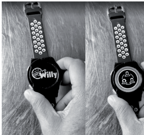
Figura 1. Dispositivo wearable-smartwatch Willy con las funciones de bienvenida y llamado grupal identificadas por un símbolo lúdico