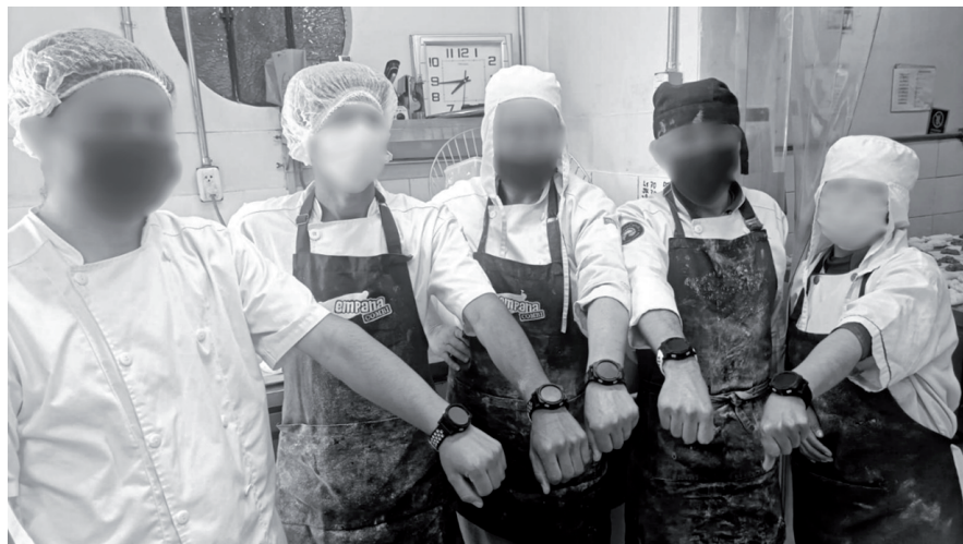
Figura 2. Los 5 dispositivos wearable-smartwatch Willy colocados en el brazo de los trabajadores de la empresa Empanacombi, del Grupo Empresarial WillCorp Perú SAC

Se utilizó la cámara de un iPhone 11 para obtener un video del ensayo y luego se recolectó la data de las variables temporales usando la técnica de observación. Por ejemplo: se recolectó el tiempo de respuesta al recibir un mensaje de alerta para ejecutar la actividad solicitada, así como el tiempo de respuesta individual o grupal de los trabajadores, quienes utilizaron 5 smartwatches Willy (4 para los operarios y 1 para un administrador, como se muestra en la figura 2).