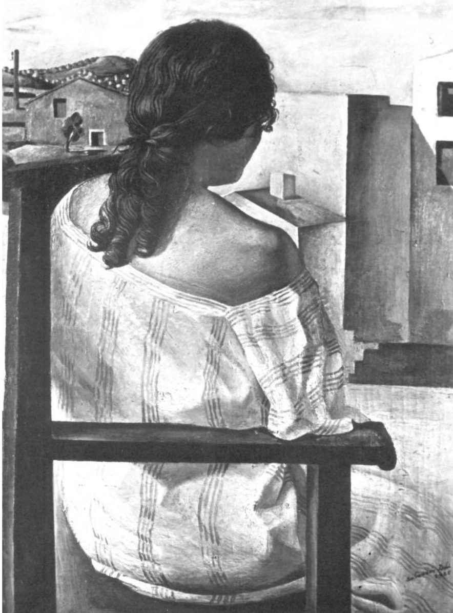
Salvador Dalí. Dama de espaldas.