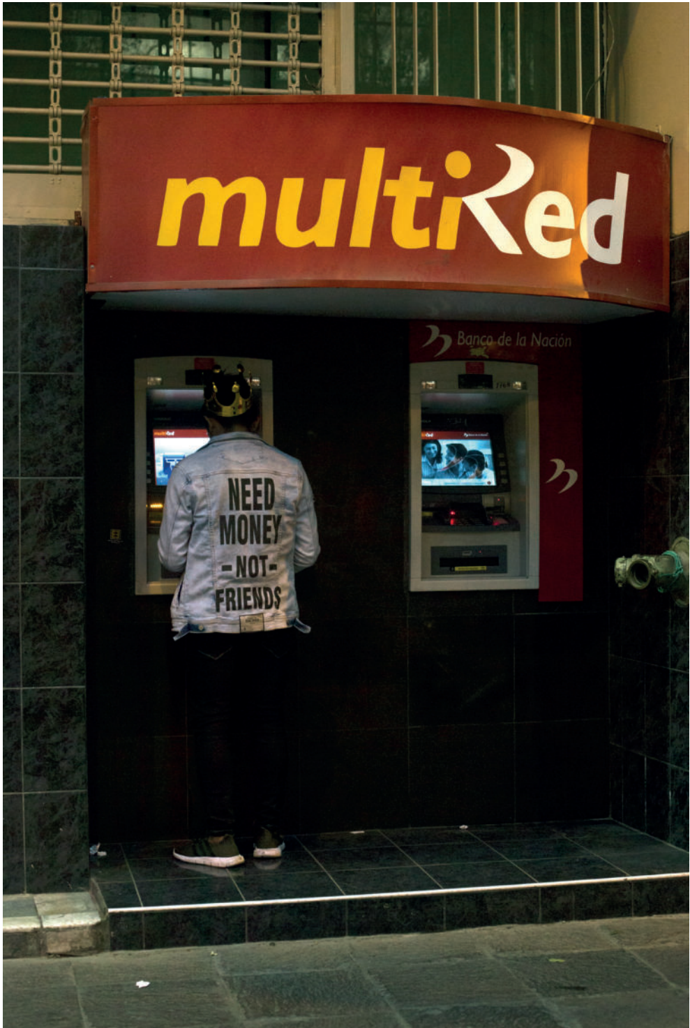
Centro de Lima