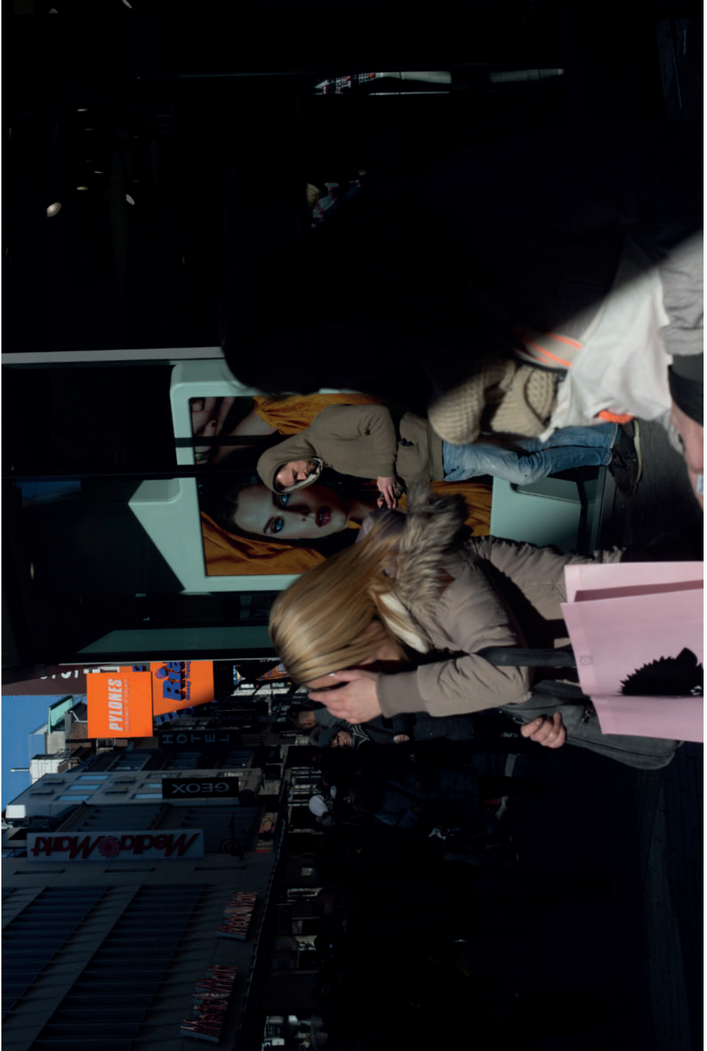
Colonia - Alemania