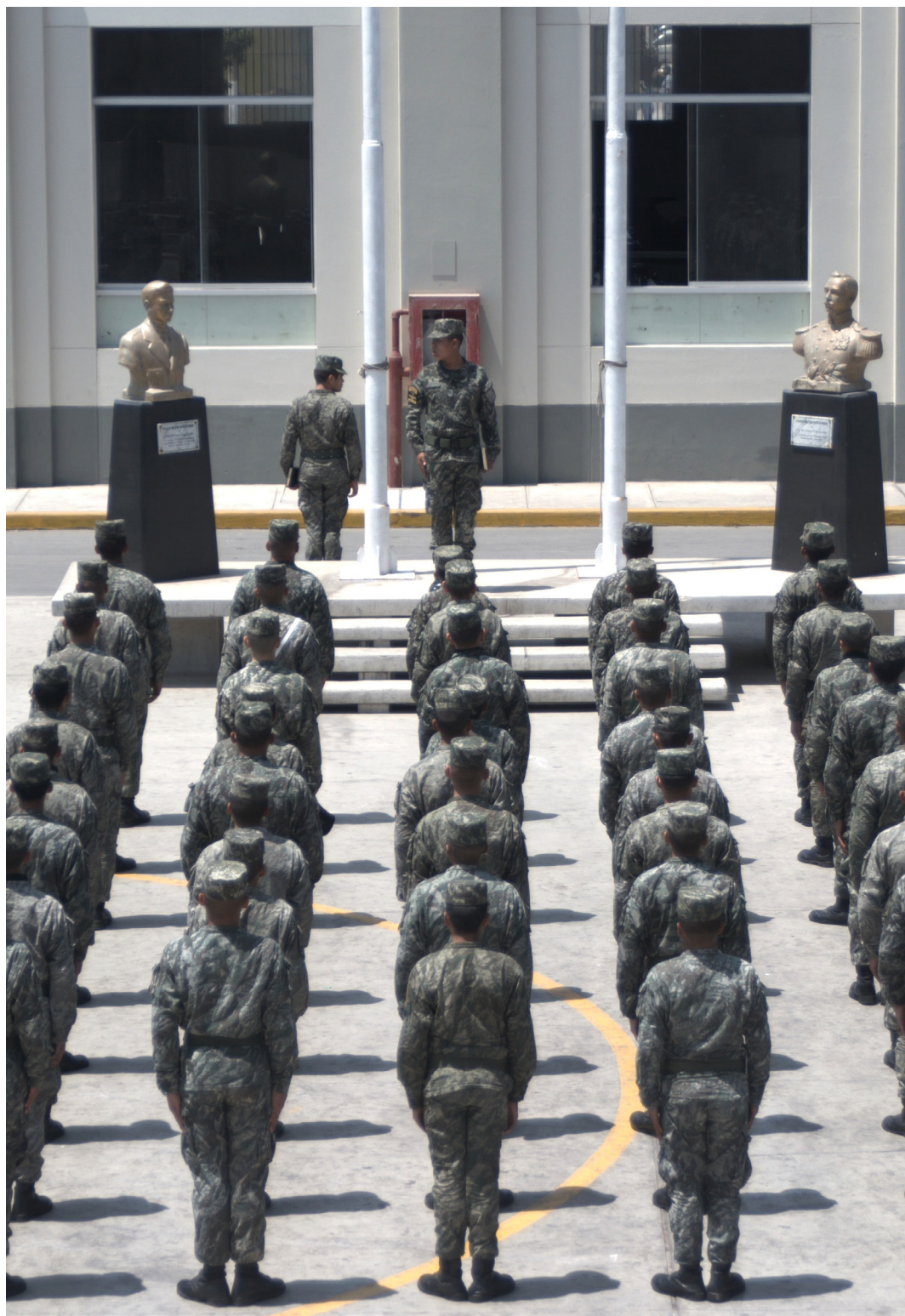
FORMACIÓN ANTES DEL "RANCHO" DEL MEDIODÍA (Nikon D7100, 55mm, F: 4.2, 1/1250s)