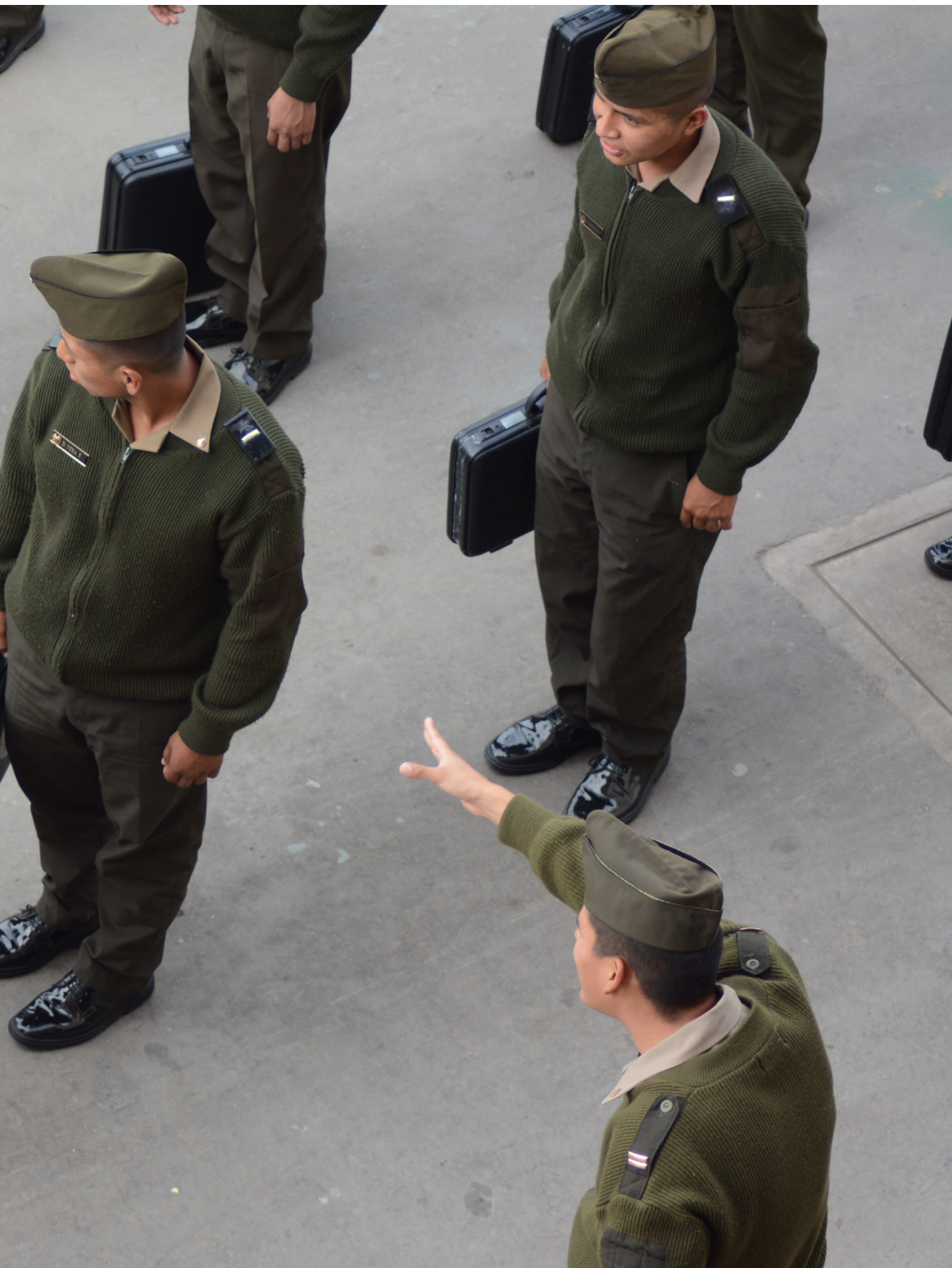
LLAMADA DE ATENCIÓN (Nikon D7100, 70MM, F: 4, 1/250s.)