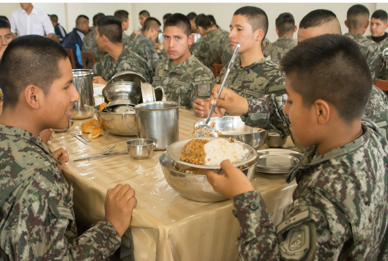
SERVIR A LOS OTROS (NIKON D7100, 28 MM, F: 4, 1/1200s)