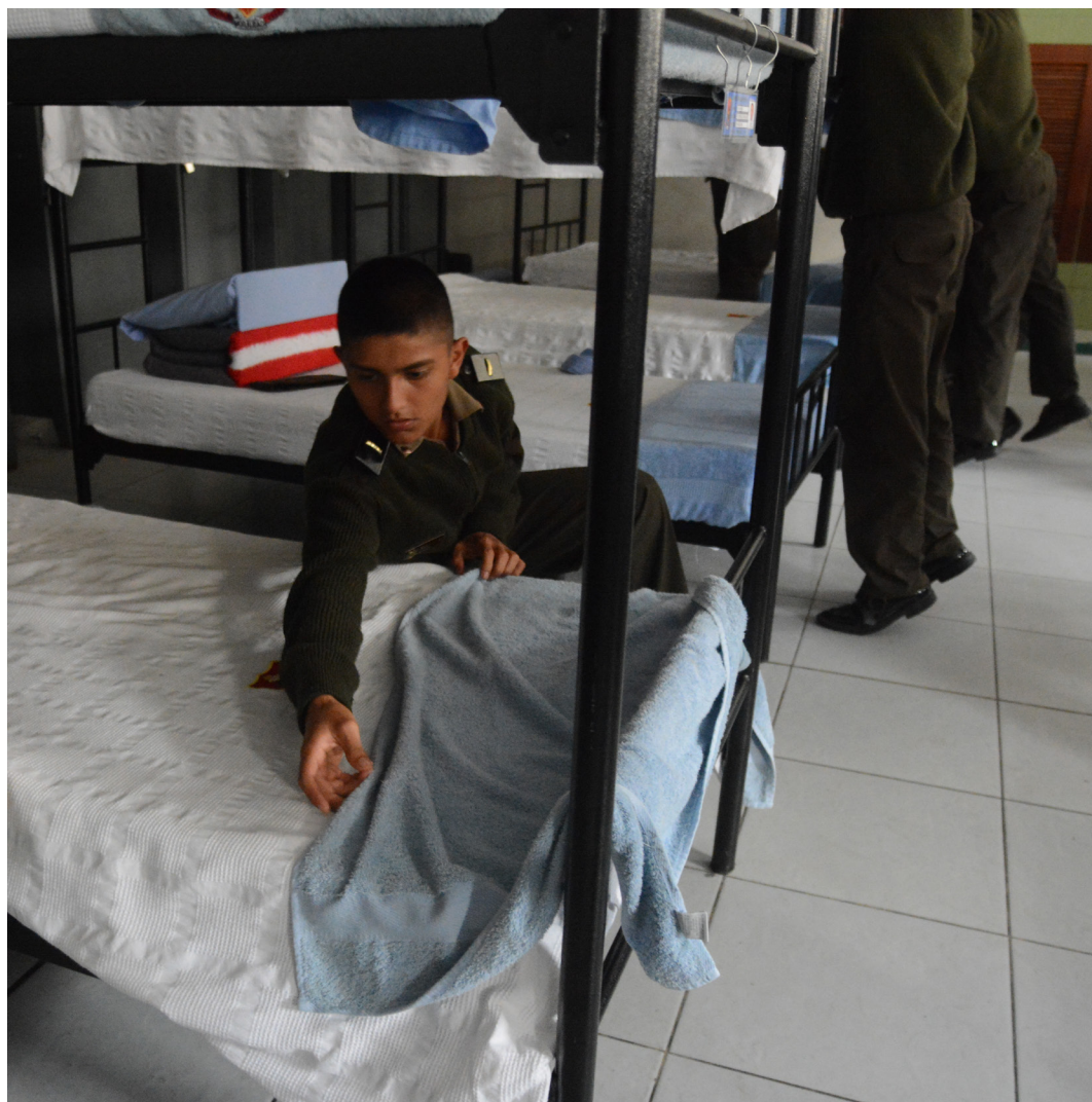
LISTOS PARA LA REVISIÓN (NIKON D7100, 17MM, F: 2.8, 1/80s.)