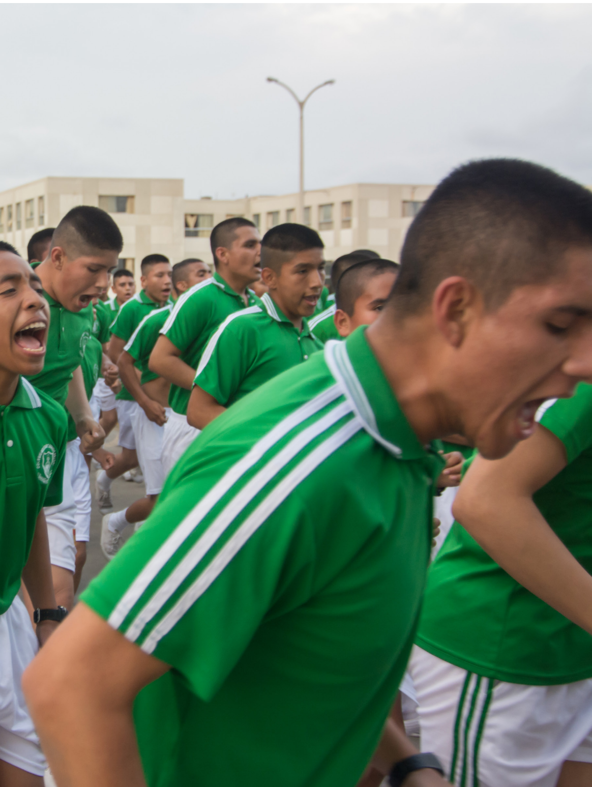
GARRA LEONCIOPRADINA (Nikon D7100, 28mm, F: 3.8, 1/500s)