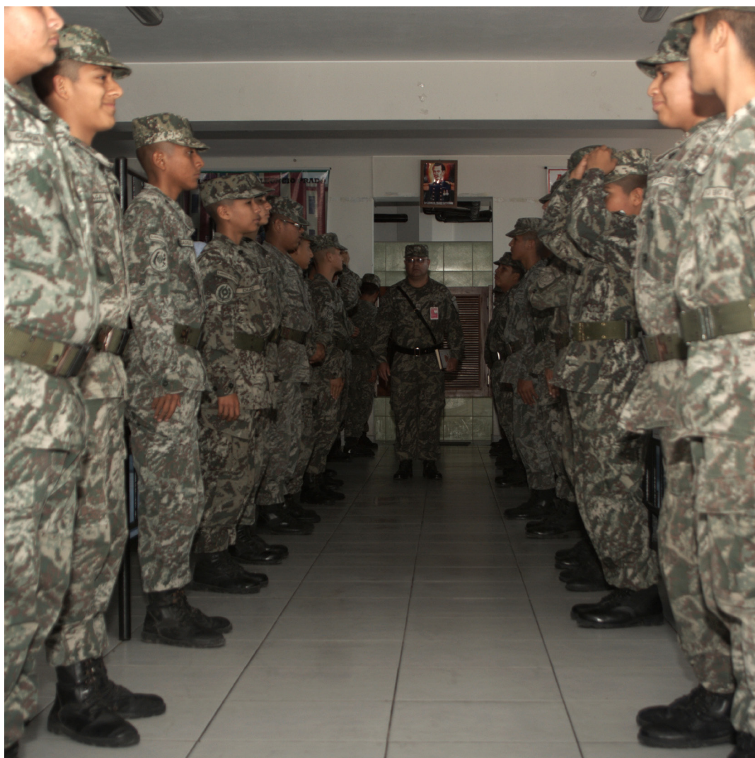
FORMACIÓN EN LAS CUADRAS (NIKON D7100, 28MM, F: 4, 1/125s)