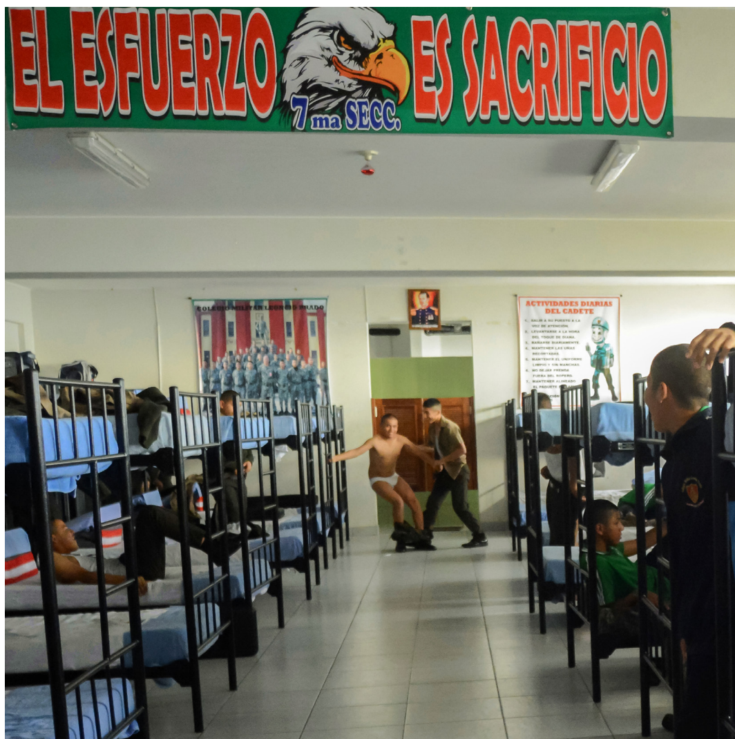
ALUMNOS DE TERCERO EN SUS CUADRAS, RATOS LIBRES. [Nikon D7100, 17mm, F: 2.8, 1/320s]