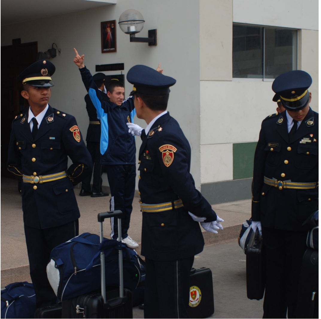
ALUMNO CASTIGADO (SIN SALIR) DESPIDIENDO A SUS COMPAÑEROS. (NIKON D7100, 35MM, F: 4, 1/400s)