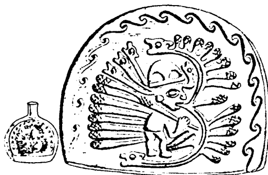
El ser sideral con rayos transformados en choclos.

Reproducciones de vasos antiguos y notas de Rebeca Carrión Cachot. (1959).