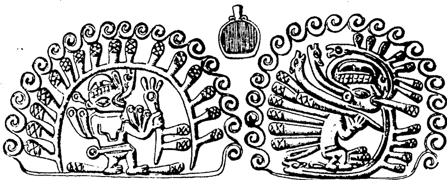
La Deidad sideral bajo un arco con rayos fitomorfos y cetro germinativo (izq.), y con apéndices bucales y rayos en forma de choclos (der.).