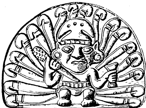
La Deidad Solar circundada de rayos.