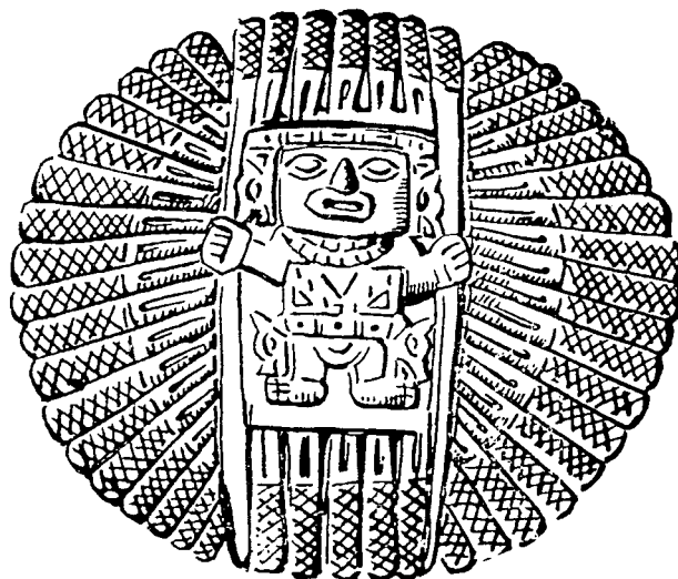
La Deidad Solar con rayos en forma de choclos (mazorcas de maíz).