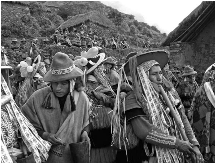
Foto 2. Carnaval en Q'eros