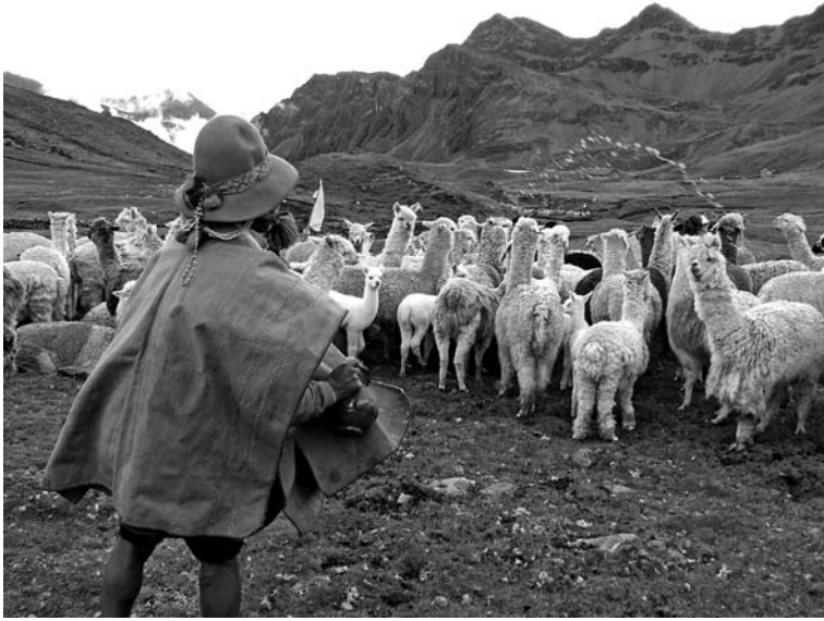
Foto 1. Rito de fertilidad de las llamas y alpacas hembras