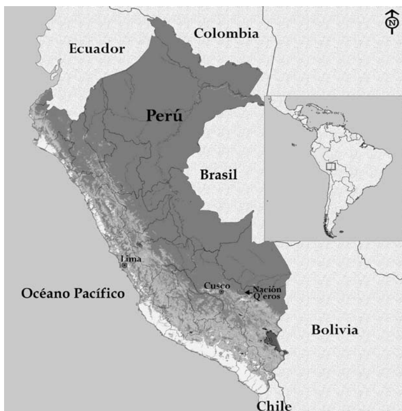
Mapa 1. Ubicación de la Nación Q'eros

Los q'eros practican todavía los cantos autóctonos 3 emblemáticos de su comunidad. En esta ponencia analizo el modo cómo ambas, las canciones indígenas de Q'eros y la música y danza que ellos recién incorporaron en la peregrinación de Qoyllurit'i, logran la eficacia del propósito a través de similares técnicas de producción de sonido y criterio estético. Uno de los principales propósitos de la música de Q'eros es regenerar y re-crear , 4 activamente, las buenas relaciones con el mundo espiritual en el que creen, ya sea con los apus (montañas poderosas),