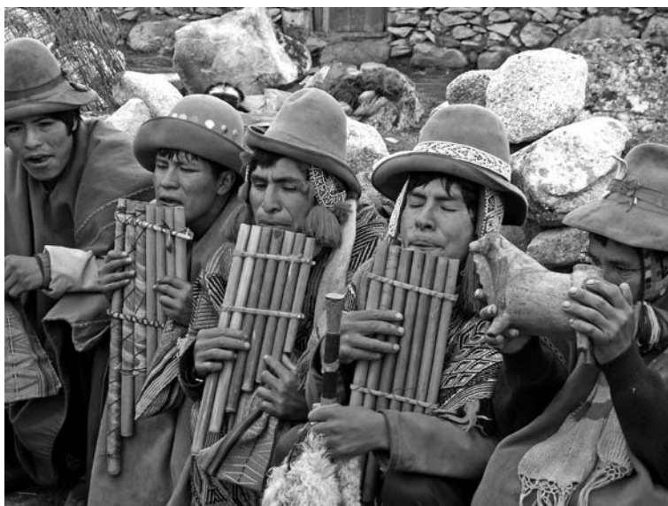
Foto 4. Tocando Qanchis Sipas