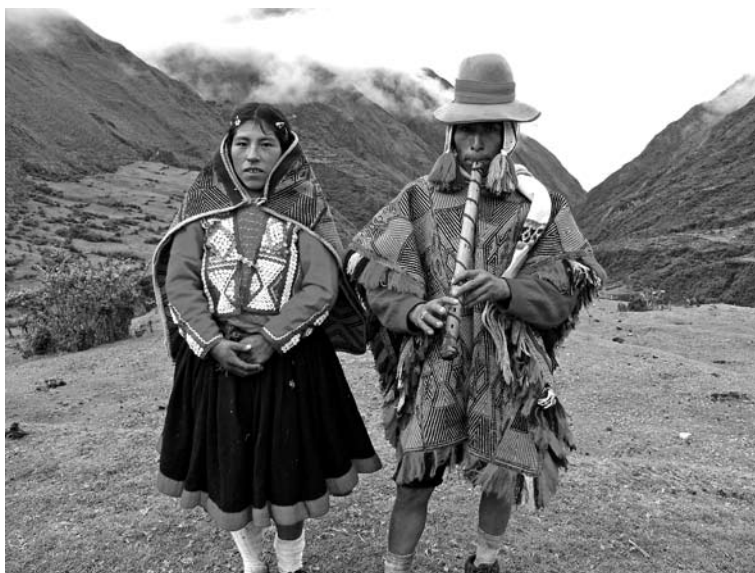
Foto 3. Pareja de q'eros