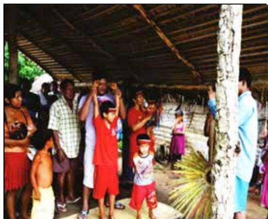
Figura 3. Ritual de nominación de niño Aroroe.

Hay situaciones, entre tanto, en esa misma práctica social, en que maestra y aprendiz realizan la misma acción. Los dos hablan, aunque la autoridad repose en el anciano maestro.