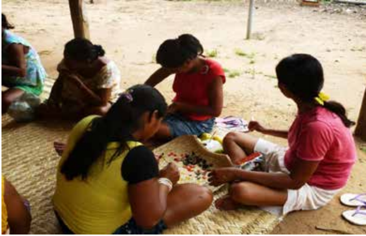
Figura 2. En primer plano, tres mujeres Aroroe confeccionan adornos para el ritual de nominación.

Junto con las mujeres aroroe están sentadas la tía y la abuela paterna de los tres hijos de la mujer que recibirá el nombre Aroroe. Abuela y tía pertenecen al clan Baado Jebage y preparan los adornos de ese clan para los niños, con plumas de guacamayo rojo. Tres ancianos, un aroroe, un baado jebage y un apiborege estaban próximos a las mujeres, sentados en bancos cerca de la estera. De vez en cuando las mujeres se levantaban, iban hasta ellos con los adornos en confección sobre la botella y les consultaban en cuanto a la composición del diseño del clan que ellas estaban formando con las plumas.