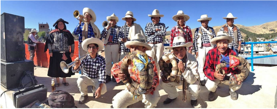
Foto 6. Banda típica Llaqtay Fiesta, acompañada por cantora. Lugar: distrito de Santo Tomás, provincia de Chumbivilcas.

Los cánticos femeninos en solitario son conocidos por los pobladores como wankas . Estos eran interpretados por un grupo de cuatro o seis mujeres durante las wasichanas o techado con paja de las viviendas en las comunidades campesinas y centros poblados; en los trabajos de la siembra durante los meses de agosto, setiembre y octubre en las zonas agrícolas de la provincia de Chumbivilcas; en las fiestas patronales, dedicadas a la virgen, santa o santo patrono de la población durante la noche de víspera del día central y otras partes de la fiesta; en las batallas rituales que se realizan en Toqto —zona fronteriza ubicada entre las provincias de Canas y Chumbivilcas— y aquellas que algunas personas de mayor edad recuerdan haber oído en su niñez, y las wankas de despedida, dedicadas a los familiares que realizaban algún viaje lejos de su hogar. Es posible que estas últimas fueran olvidadas casi por completo, pues además de no escucharse hace varias décadas, las personas adultas y de menor edad del distrito no saben de su existencia.