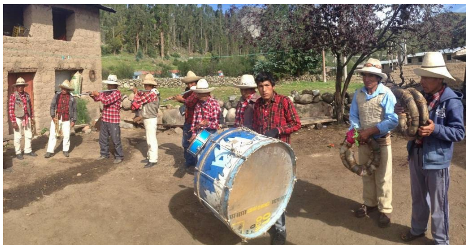
Foto 4. Banda típica Santo Tomás acompañada por waqras de la comunidad campesina Pallpa Pallpa, distrito de Quiñota. Lugar: comunidad campesina de Kututo, distrito de Llusco, provincia de Chumbivilcas. Foto: Hubert Ramiro Cárdenas, 2018.

La conformación instrumental de la banda es flexible; en ese sentido, existen bandas típicas que tienen una conformación cuyo número de integrantes es superior al habitual. Esta variación se debe a que, en primer lugar, existen bandas integradas por un número mayor de componentes; en segundo lugar, los componentes adicionales son músicos que están en proceso de aprendizaje, y en tercer lugar, son proporcionados como un favor de amistad y buena voluntad por los familiares o allegados del cargo para que acompañen a la «banda oficial». Esta manera peculiar de apoyo, otorgada en bienes o servicios, es denominada: wikch'upa .