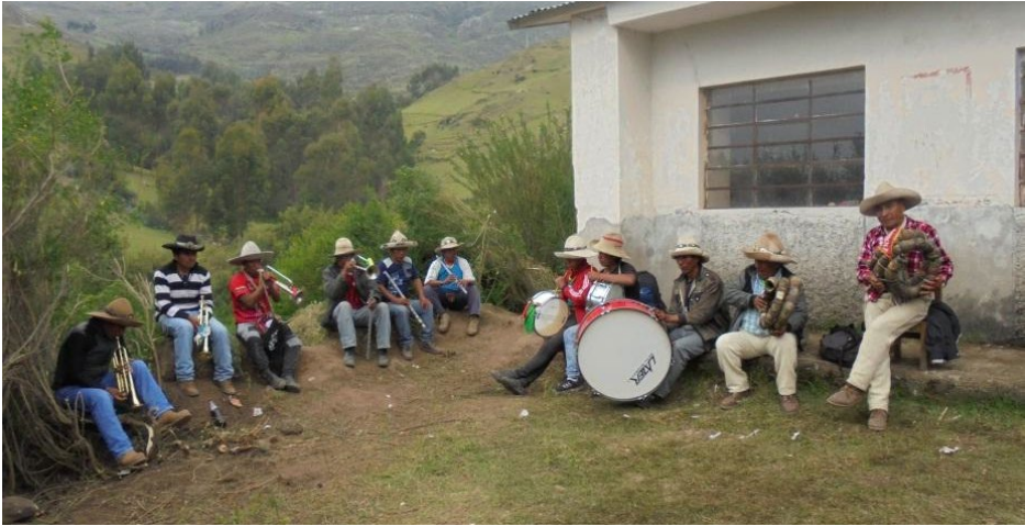
Foto 5. Banda típica Nietos de Taukamarka, acompañados por dos wikch'upa trompeteros y waqras de la comunidad campesina de Pfuisa, distrito de Llusco. Lugar: comunidad campesina de Pfuisa, distrito de Llusco, provincia de Chumbivilcas. Foto: Hubert Ramiro Cárdenas, 2018.

Los acuerdos pactados —muchas veces realizados únicamente de forma verbal— consisten en el adelanto del cincuenta por ciento de la remuneración económica al iniciar la fiesta, alimentación y alojamiento durante los días que dure el cargo o celebración, y el cincuenta por ciento restante al final. La remuneración económica que recibe cada uno de los componentes de la banda típica, incluyendo el uma , es equitativa y contabilizada por cada día de servicio 9 .