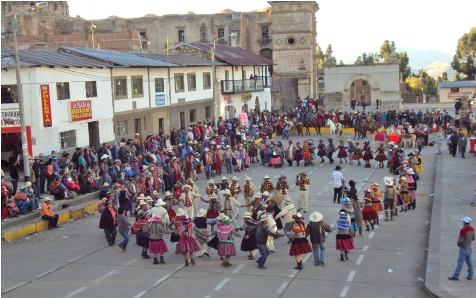
Foto 7. Banda típica en medio de una gaswa , durante la haykuna o entrada, inicio de la fiesta de la Virgen de la Natividad. Lugar: distrito de Santo Tomás, provincia de Chumbivilcas.

la corrida costumbrista. Los waynomarineras y waynus también son interpretados libremente durante la fiesta patronal organizada por el carguyuyq torero.