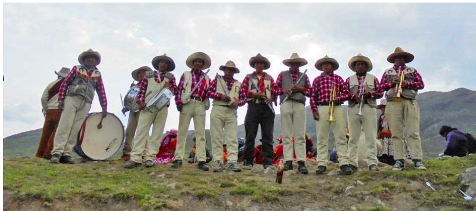
Foto 3. Banda típica Huamanripaq. Lugar: comunidad campesina de Pfuisa, distrito de Llusco, provincia de Chumbivilcas. Foto: Hubert Ramiro Cárdenas, 2018.

se despide a las personas que traerán a los toros para el juego; el toril velana , realizado la víspera del turupukllay , en donde un paqu se encarga de dar una ofrenda a la Pachamama para que el día siguiente el juego de los toros sea exitoso; la tranquilla watana o atado de la tranquilla que facilita el ingreso y salida de los toros al ruedo; el turupukllay , y la banda kacharpari , almuerzo con que los «dueños del cargo» despiden a los músicos de la banda típica.