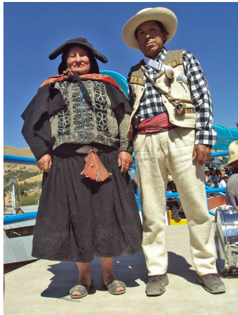
Foto 8. Vestimenta de integrantes de banda típica. Lugar: distrito de Santo Tomás, provincia de Chumbivilcas. Foto: Hubert Ramiro Cárdenas, 2015.

El traje de las cantoras reivindica la vestimenta tradicional de las mujeres de la población originaria de la provincia. Confeccionado sobre todo de bayeta, está integrado por una montera hecha de paja brava o ch'illwa , recubierta con la tela mencionada de color negro, debajo de la cual usan un velo del mismo material y color al que llaman suk'u o suk'uta ; camisa blanca sobre la que visten chaqueta gris, cuyos bordes delanteros llevan cosida una tela negra que en ocasiones lleva zurcido con hilo blanco motivos florales, y una ch'uspa o bolso pequeño que cruza el pecho, usado para guardar hojas de coca y llipt'a . Para abrigarse, se cubren la espalda y hombros con un phullu o mantón negro encima del que llevan una lliklla o manta en la que transportan productos diversos. Asimismo, usan en la cintura un chumpi o faja con la que sujetan la distintiva pollera negra y, a manera de enaguas, tres o más p'istus o mantillas, usualmente blancas.