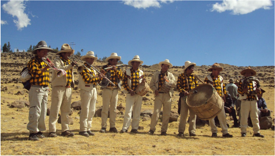
Foto 2. Banda típica Los Auténticos de Marka Marka. Lugar: distrito de Santo Tomás, provincia de Chumbivilcas.

Hoy en día, la flexibilización de la estructura social de la provincia ha permitido el tránsito fluido de los músicos y la población en general entre las comunidades campesinas, centros poblados, distritos y la capital de la provincia, la amplia difusión endoprovincial de bandas típicas y conjuntos de cuerdas por los medios masivos de comunicación, internet, mercados alternativos autogestionados de producción y distribución de música provincial 3 , y la apertura e incremento de un mercado accesible y económico de instrumentos musicales de todo tipo. Actualmente se puede verificar, por un lado, la permanente actualización y fortalecimiento de dichas manifestaciones musicales, y por otro, el tránsito irrestricto de los músicos chumbivilcanos entre bandas típicas y conjuntos de cuerdas en las distintas festividades públicas y privadas de las que participan, evidenciando que la división social, cultural y económica que alguna vez existió en el uso de instrumentos musicales está a punto de extinguirse.