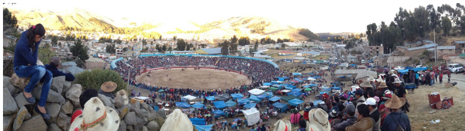
Foto 1. Vista panorámica del turupukllay o juego de los toros , corrida de toros costumbrista donde no se hiere, tortura, ni asesina al animal. Lugar: distrito de Santo Tomás, provincia de Chumbivilcas.

Dicha actividad, cuyos antecedentes se remontan a la época prehispánica, tuvo vital importancia en el Estado inca, donde se disponía de enormes hatos de llamas y alpacas que servían como transporte de carga, materia prima para productos textiles y de cuero, alimento y ofrenda ceremonial. Con la invasión hispana, se introdujeron los ganados vacuno, equino, ovino, caprino y porcino, cuyo asentamiento complementó en el espacio rural y sustituyó en el urbano las funciones que tuvieron sus antecesoras, las cuales fueron desplazadas a un segundo plano (Castro, 1999, pp. 12-14).