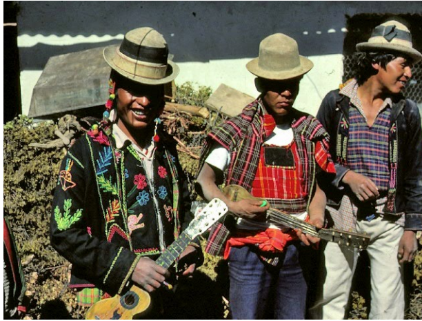
Foto 1. Jóvenes con charangos en una fiesta durante la estación seca (Sacaca, norte de Potosí, Bolivia).

el siguiente texto de una canción que se asemeja a un acertijo 18 . Cuando una mujer eventualmente abandona su hogar de la aldea para vivir con un hombre, es acompañada durante su viaje por un grupo de jóvenes «cazadores» que van tocando charangos 19 .