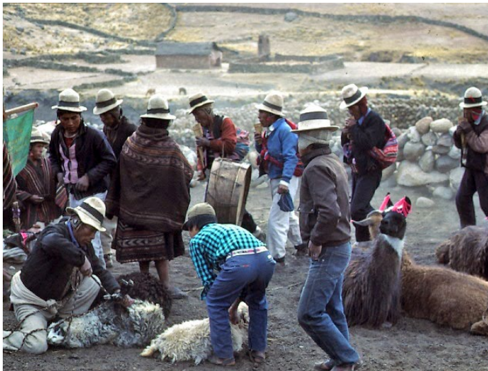
Foto 4. Un grupo de zampoñeros ( sikus ) con bombo rodeando las llamas y ovejas seleccionadas para la matanza en la ceremonia uywa ñakakun (región de Macha, norte de Potosí, Bolivia).

Para mi anfitrión andino, el punto central del banquete es la carne, la cual adquiere un sentido simbólico elevado y una significancia sensorial debido a su consumo inusual en otras temporadas. El sacrificio de los animales ( uywa ñakakun , «matanza de los animales criados») para la fiesta principal por lo general se realiza en la víspera del día de la fiesta propiamente dicha. En muchos aspectos, esto sirve para dar inicio al procedimiento de festejos, que puede extenderse por varios días. La ceremonia del uywa ñakakun es también el momento en que se empieza el consumo del alcohol y se oye por primera vez la música durante la festividad. Según me contaron, la música se toca para la manada de animales como consolación ( kunswilu ) y para asegurar la futura «multiplicación» ( mirananpaq ) del rebaño (véase foto 4).