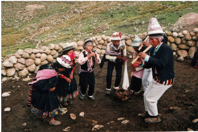
Foto 3. Una olla de barro de chicha ( aqha ) rodeada por un grupo de flautistas de pinkillu y cantantes en un corral de llamas durante la fiesta de Carnaval (región de Macha, norte de Potosí, Bolivia).

de una calabaza partida por la mitad y a menudo una botella de cañazo rebajado con agua. Este se coloca típicamente en el centro del círculo formado por los músicos y el alcohol circula durante todas las pausas de la música (véase foto 3). Así, para los músicos y para todos los demás asistentes a la fiesta, la música está casi siempre filtrada a través de los efectos sensoriales del alcohol. El flujo constante de la música como sonido se corresponde con el del alcohol, los dos interactuando mutuamente en la liberación y recirculación de la energía sensorial. El reparto del alcohol marca el inicio de cualquier fiesta, cuando la música también debe empezar a fluir, así como el agotamiento de la chicha señala el final de la fiesta cuando la música casi automáticamente cesa.