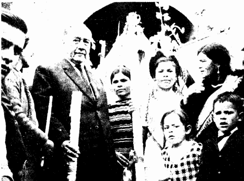
Fotografía III: Fiesta indígena para que los mestizos se diviertan. Al fondo la imagen de la Virgen de Candelaria saliendo de la Iglesia.