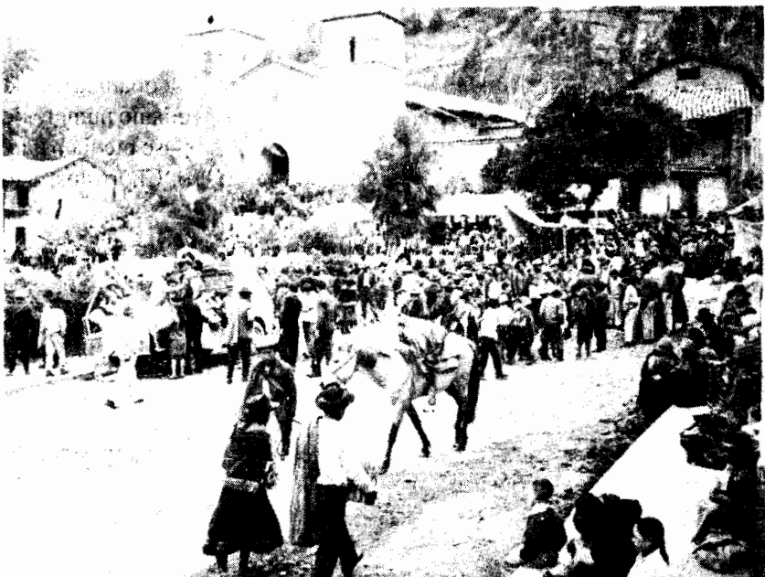
Fotografía IV: Día central, procesión y feria en la plaza de armas del pueblo.