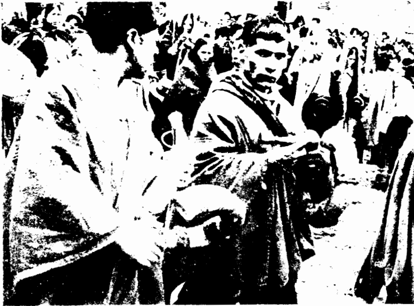
Fotografía I: Los waqrapukus , músicos consustantivos a la fiesta de la comunidad.