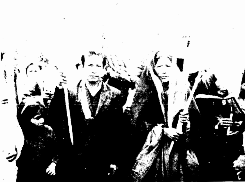
Fotografía II: Los " Cargoyoc ", organizadores y responsables de la fiesta.