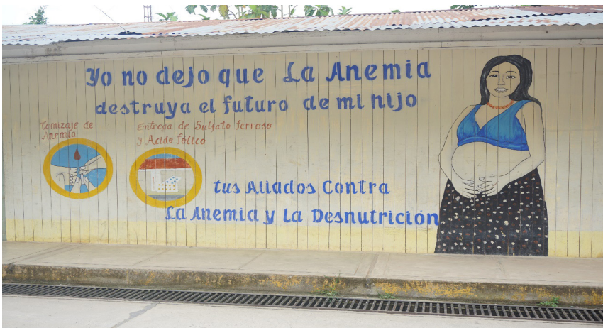
Foto 1. Mural pintado en las afueras de la Red de Salud Condorcanqui.

En esa misma línea, durante esa sesión, a pesar de lo poco dialógico y bastante fiel a los manuales que se mostraba la producción del conocimiento sobre la anemia, pude observar algunos intentos de una traducción creativa que invitaba a los asistentes a imaginar los estragos de la anemia en su organismo y capacidades. Para ello, la misma facilitadora presentó de manera entusiasta una cartulina, en la cual estaba dibujada una especie de cuadrícula que señaló era una red de pescar. Luego preguntó. «¿A todos nos gusta pescar no? Y regresar llenos de pescados para comer», a lo que los asistentes respondieron afirmativamente y haciendo algunas bromas. Seguidamente, explicó en tono pedagógico que todos tenemos en nuestra cabeza una red como esa y, por tanto, lo que la anemia hace es agujerearla, lo que trae como consecuencia que los peces del conocimiento