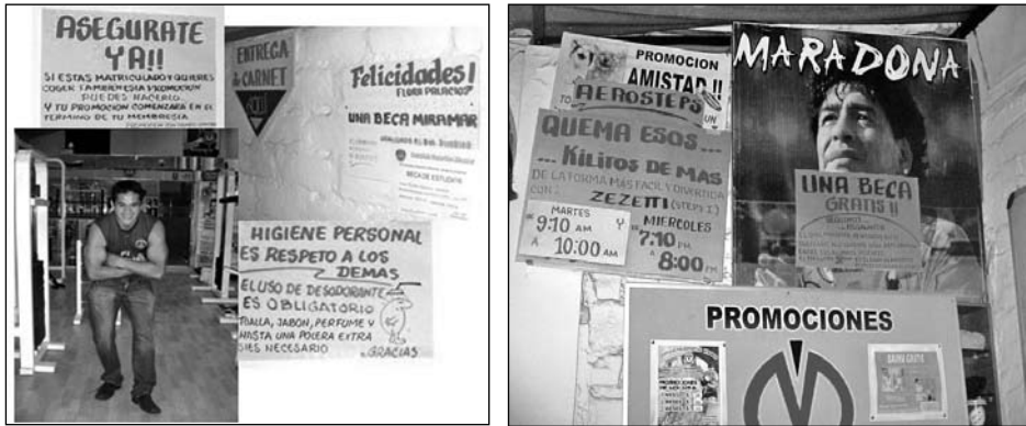
Carteles del Gimnasio Miramar