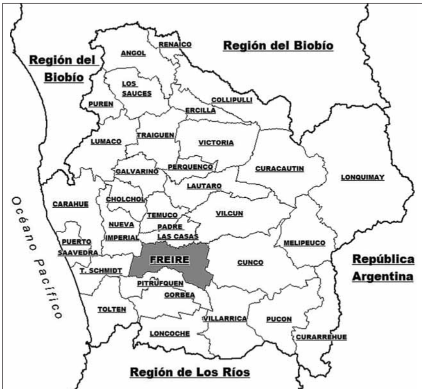
Figura 1. Mapa de la región de la Araucanía, comuna de Freire

La comunidad Andrés Coliqueo se ubica en el sector Huilio, comuna de Freire, perteneciente a la región de la Araucanía. Se trata de la segunda región con mayor porcentaje de población rural del país (32,3% al año 2002), con los peores indicadores de pobreza (27,1% al año 2006) (CASEN, 2006). Es también la que concentra mayor población mapuche 2 rural del país (23,5% al año 2002) (INE, 2002).