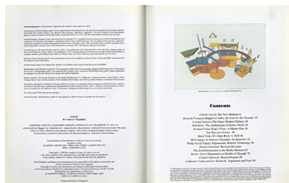
Página interior e índice la revista Architectural Design , vol. 60, n.º 3-4, 1990.

En una cultura de consumo como la contemporánea, que convierte la arquitectura en un servicio o un vehículo para la producción de objetos de consumo masivo, Frampton intenta romper la dinámica con una postura de enfrentamiento radical, basada en una actitud de «retaguardia». Es un llamado a la arquitectura luego de —o quizás en medio de— los peores años de superficialidad en todo el sentido de la palabra, asociados directamente a una cultura del consumo, al arte como entretenimiento y al individualismo como seña de la época, una época en la que —como lo señala Mary McLeod— todo