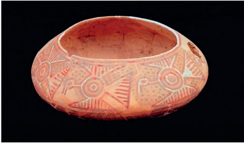
Figura 6. Olla sin cuello con figuras de aves.