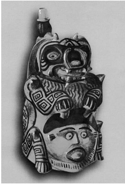
Figura 12. Vasija estilo Nievería con representación antropomorfa y de felino (Foto: Carátula del Cuaderno de Investigación del Archivo Tello N°1, Museo de Arqueología y Antropología de la Universidad Nacional Mayor de San Marcos).