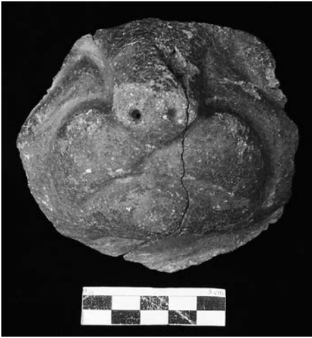
Figura 2. Rostro modelado en arcilla de un lobo de mar.