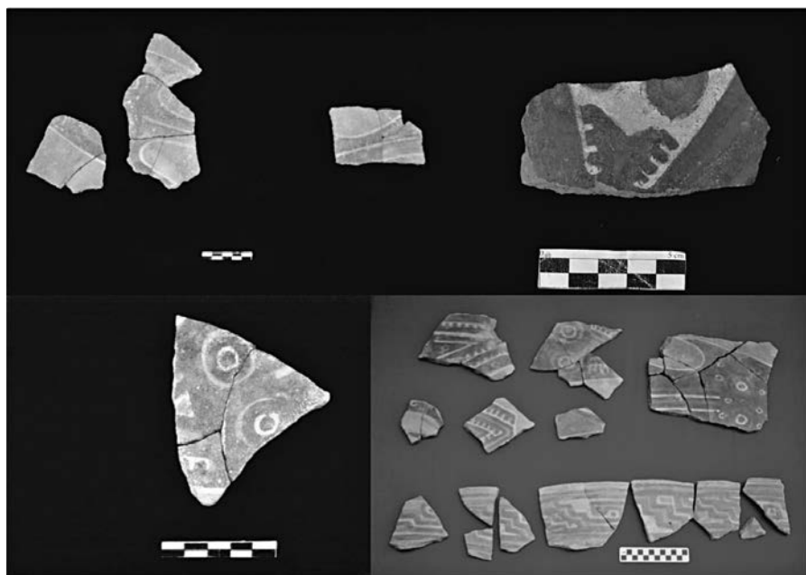
Figura 15. Fragmentos de cerámica con representaciones estilizadas de tiburones.