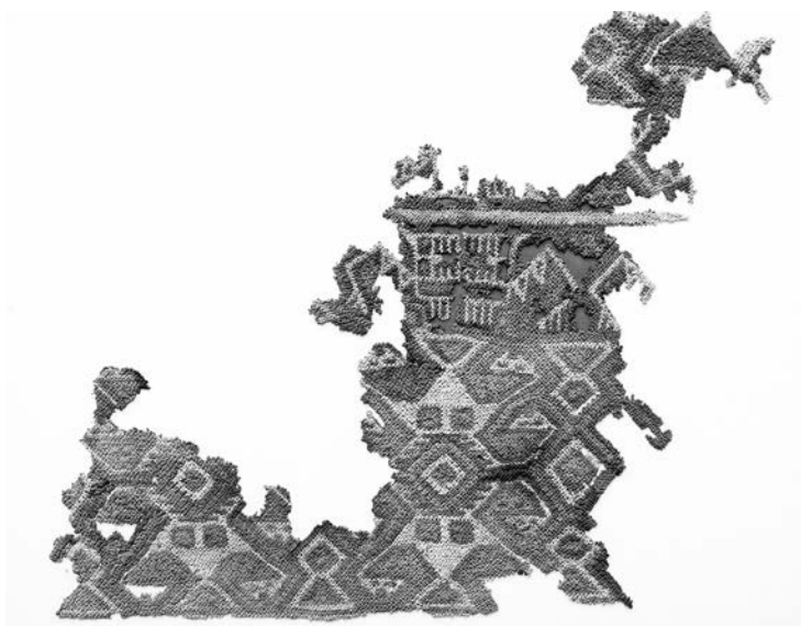
Figura 16. Textil con representación estilizada de tiburones entrelazados.