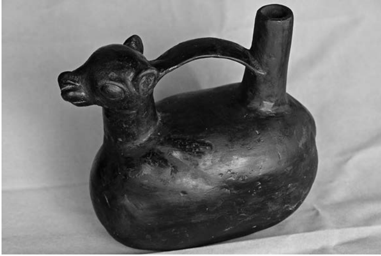
Figura 13. Representación escultórica de camélido.

que muestra los dientes, a cada lado en la parte superior se muestran los ojos de forma romboidal que enmarcan la aparente nariz. Hallamos que esta figura aparece en otra forma en cerámica del Complejo Maranga, recuperada por Jacinto Jijón y Caamaño (Lumbreras 2011). Allí vemos a esta figura reducida de forma cuadrangular, donde la boca se ha reducido a un rectángulo y los ojos son pequeños cuadrados sostenidos por apéndices. Esta sencilla figura es la versión simplificada de la «caras sonriente». Si comparamos con representaciones naturalistas podremos darnos cuenta que el rostro frontal del tiburón que se encuentra en la versión modelada o gollete de Pucllana se asemeja con la Cara Sonriente. De esta manera, proponemos que este rostro frontal no es otra cosa que un rostro de tiburón estilizado y representado en posición frontal, resaltando los ojos y la boca. Este tema lo hemos tratado en detalle en otro lugar (Vargas 2006: 88).