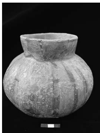
Figura 11. Olla fitomorfa.