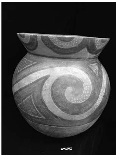
Figura 8. Cántaro con figuras de olas estilizadas.