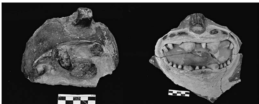
Figura 5. Fragmentos de cerámica aparentemente representando nutrias marinas.