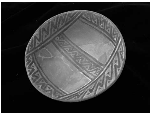
Figura 9. Plato con figuras entrelazadas (Foto: Museo de Sitio de Huaca Pucllana).