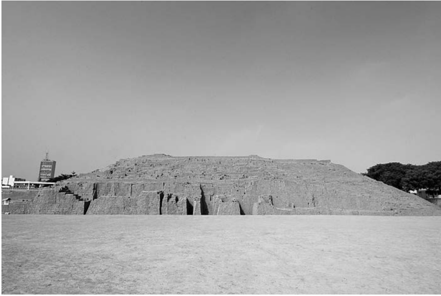
Figura 1. Vista de la fachada Norte de Huaca Pucllana.