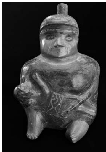
Figura 10. Representación escultórica antropomorfa de mujer con niño.