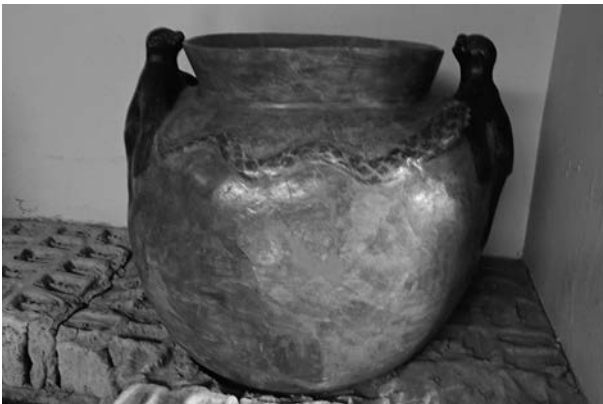
Figura 3. Cántaro con representación de lobos de mar y anguilas.

tengamos una representación de camélido, contados fragmentos y piezas completas de representaciones antropomorfas y ninguna de vegetales (aparte de vasijas de uso doméstico en forma de mate).