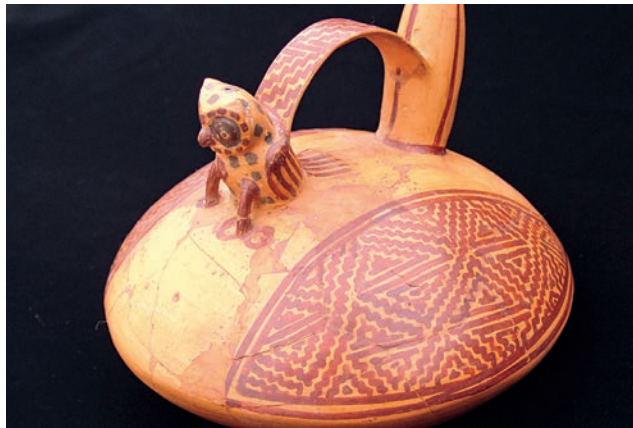
Figura 7. Vasija estilo Nievería con ave rapaz escultórica.