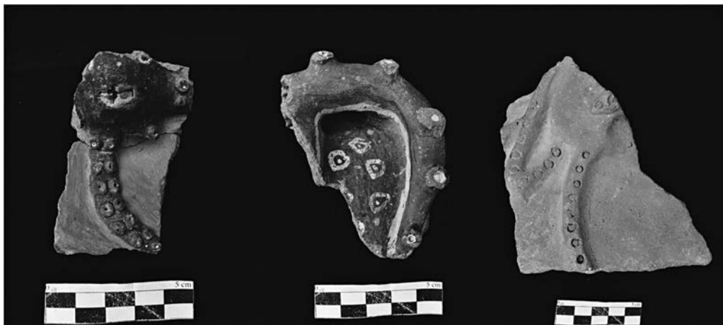
Figura 4. Diferentes fragmentos de cerámica con decoración escultórica representando pulpos.