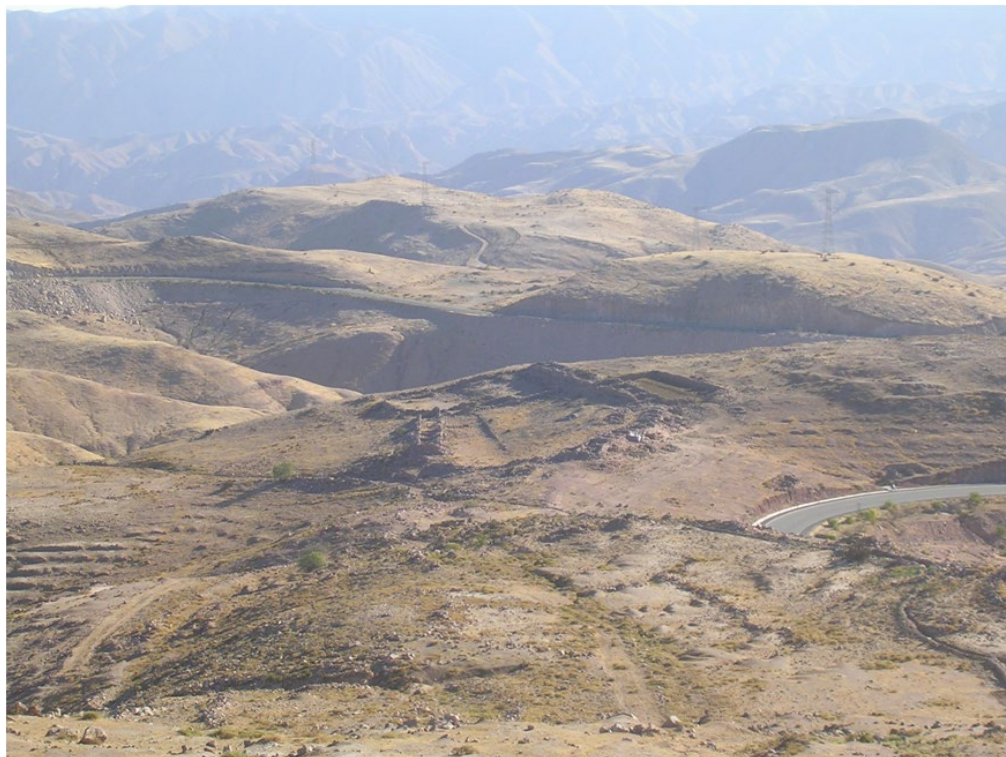
Figura 3. Vista Camata Tambo, Tambo Inca ubicado a 2,800 msnm en el valle alto de Moquegua, subregión del Cólesuyo.

del sistema imperial incaico, pero ocurrió dentro de un contexto que iba adquiriendo sentido en el nuevo discurso colonial 18 .