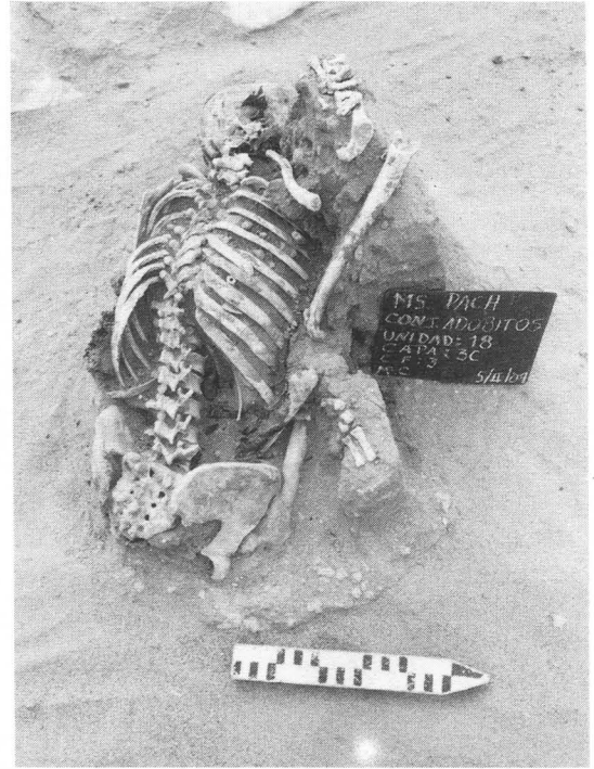
Fig. 5. Otro contexto de la misma ubicación estratigráfica.