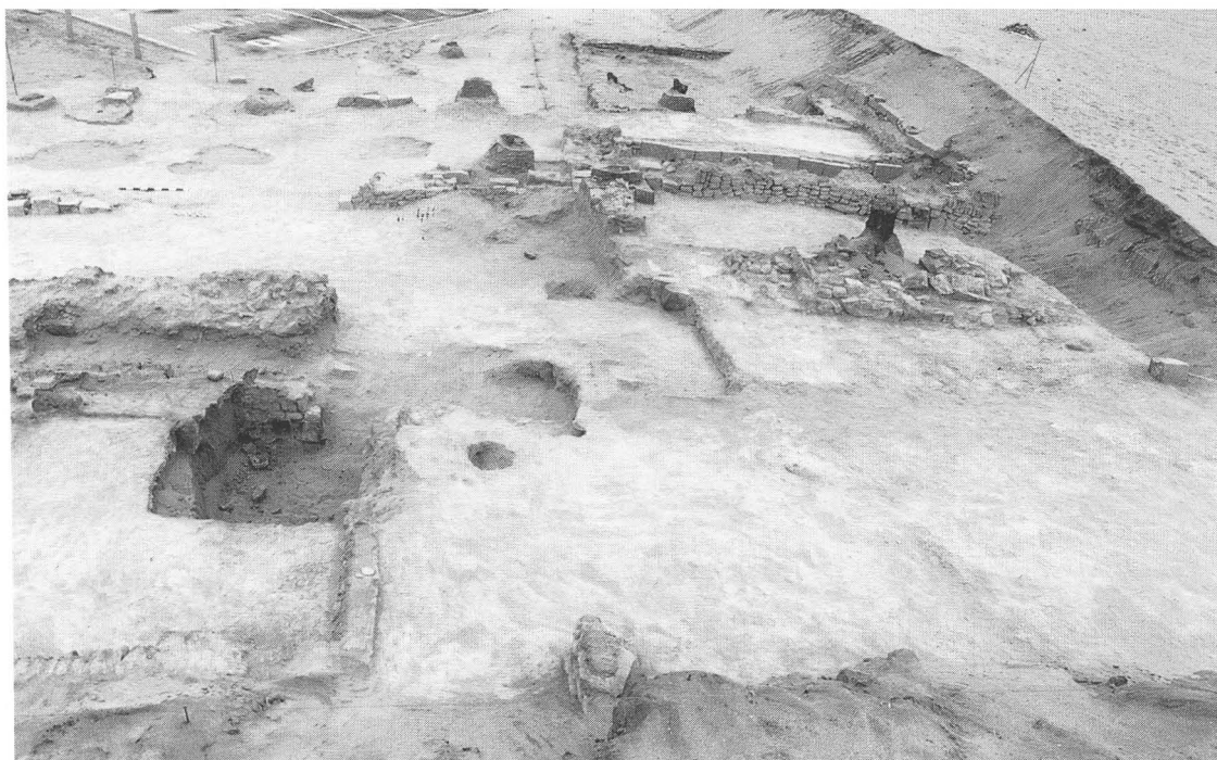
Fig. 8. Vista donde se aprecia la distribución de los postes de madera.