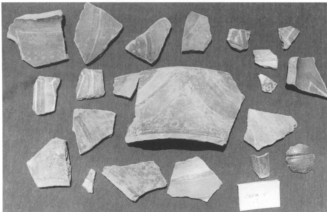
Fig. 3. Material cerámico del segundo momento constructivo.