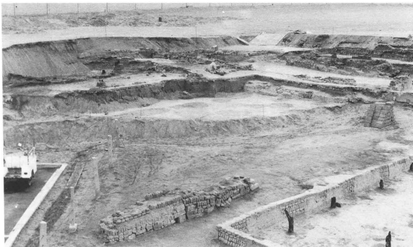
Fig. 2. Vista general del Complejo de Adobitos, donde se aprecian los tres momentos constructivos.