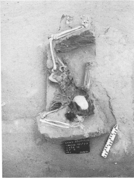
Fig. 4. Contexto secundario posterior al abandono del edificio.