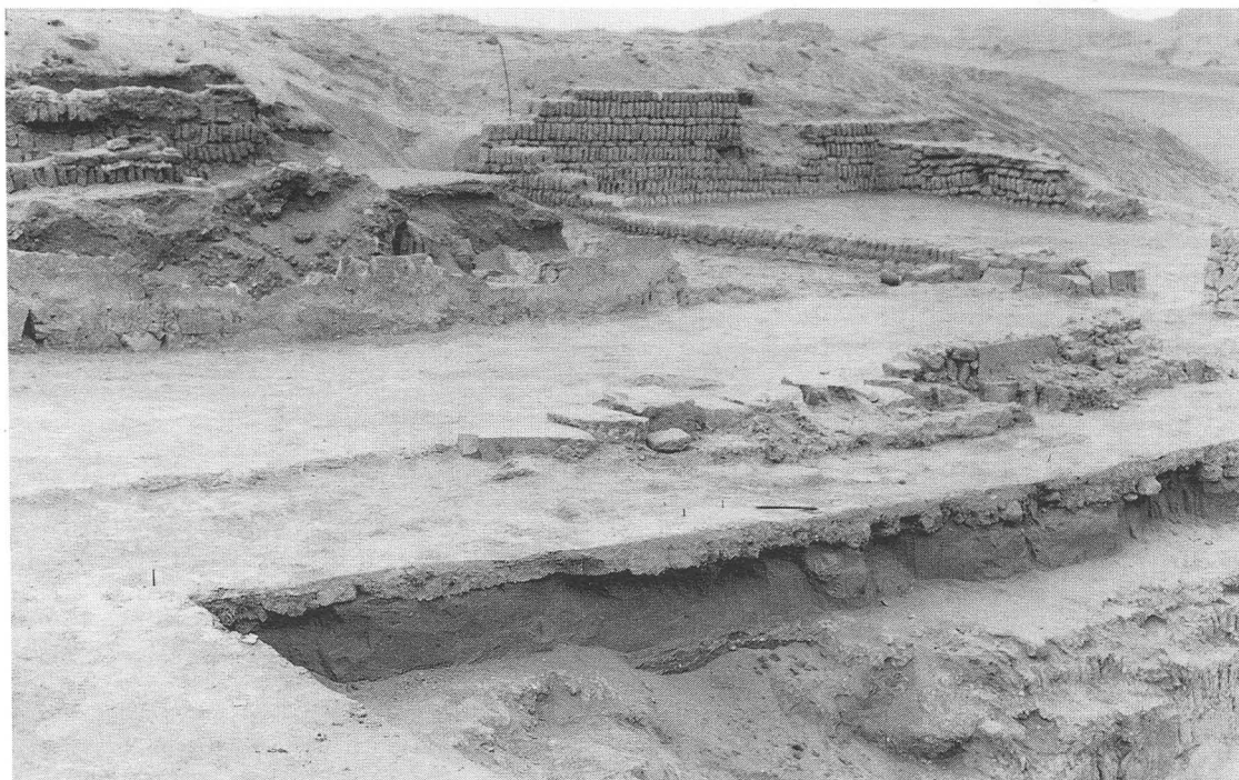
Fig. 7. Detalle de la construcción del piso y la colocación de un muro sobre el mismo.

Los restos de un edificio destruido de manera parcial, tanto por la acción humana como por el paso del tiempo, cubrían dos construcciones similares que fueron tapadas de manera sucesiva (Fig. 2). Las edificaciones se construyen mediante la reutilización de parte de los materiales constructivos del momento anterior. Así, en las tres fases se repite el patrón por el cual un relleno intencional de arena separa un momento del otro. El material asociado aún no ha sido analizado debidamente, pero parece ser bastante homogéneo y corresponde a las últimas fases de la secuencia lima (Fig. 3). Coincide también con el análisis elaborado por Lavallée del material proveniente de esta misma área. Ella señala que este material es asignable a las fases 7, 8 y 9 de Patterson, aunque mantiene diseños que pueden provenir de fases anteriores.