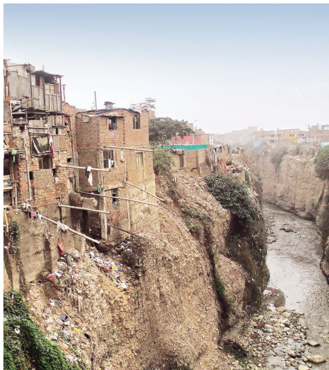
Figura 2. Mucha gente ubica sus viviendas en lugares altamente peligrosos.

Es de esperar que extrapolando este estudio a otros tipos de edificaciones la cifra de pérdida se incremente y sea evidente el alarmante déficit que tiene el país para afrontar una situación de desastre.