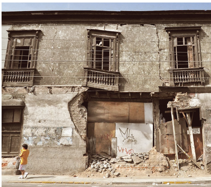
Figura 1. Muchas de las viviendas de adobe en el centro de Lima no han sido refaccionadas, estas son altamente vulnerables.

Hasta el momento, no existen métodos o técnicas que permitan predecir con exactitud el lugar, tamaño y la fecha de ocurrencia de un evento sísmico. Sin embargo, se han desarrollado métodos estadísticos que permiten establecer zonas en las que existe una mayor probabilidad de ocurrir un movimiento sísmico y aproximar su magnitud.