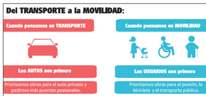
Imagen3. Movilidad sostenible.

Un plan de ordenamiento territorial va de la mano con la concertación entre todos los ciudadanos. Por lo tanto, deben promoverse las redes de comunicación activa y constructiva.