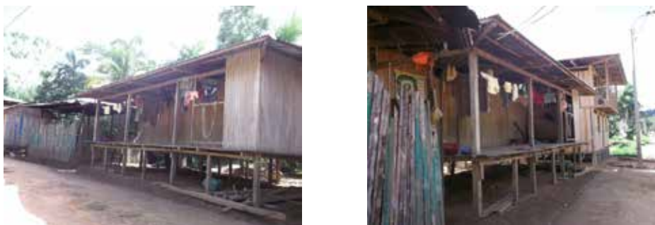
Figura 2. Vivienda machiguenga en la comunidad de Cashiriari