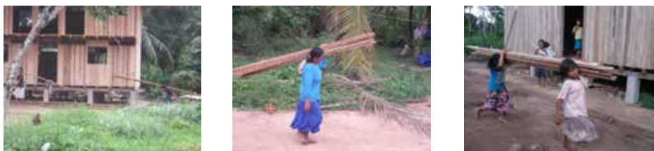
Figura 4. Mujeres, niños y niñas machiguengas trabajan como obreros