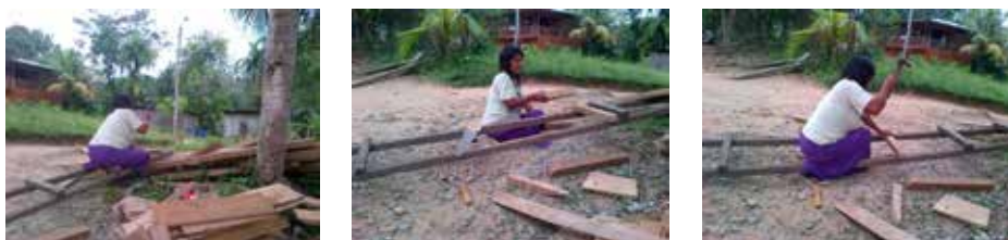
Figura 5. Mujer machiguenga construye una escalera de madera