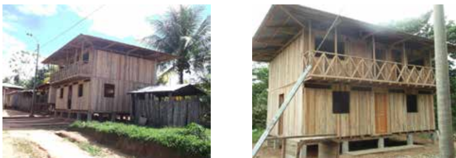
Figura 3. Nuevas viviendas machiguengas construidas en Cashiriari