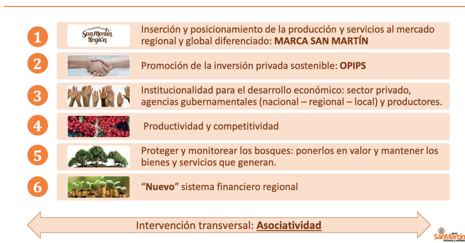
Figura 2. Líneas de intervención estratégicas de producción, protección e inclusión

En las ponencias presentadas por los funcionarios de la Gerencia de Desarrollo Económico y la Drasam, se percibe la orientación hacia la «producción, protección e inclusión» y se lanza la «marca San Martín» que según un asesor del Gobierno regional promueve no solo la producción orgánica, sino también un no al trabajo infantil, la coca, la deforestación y el lavado de dinero 20 (ver Figura 2). Esta línea es promovida por un gerente de desarrollo económico regional con años de experiencia en el PDA y diferentes organizaciones de la cooperación internacional.