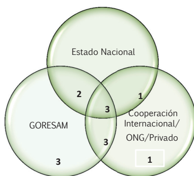
Figura 3. Rotación de personal entre Estado nacional, subnacional, cooperación internacional y sociedad civil

Según Villarán y Hurtado (2012), quienes elaboraron una propuesta de factores de éxito del Modelo San Martín, una de las primeras variables es la estrategia y las acciones de desarrollo productivo-económico. Esta variable está basada, por un lado,