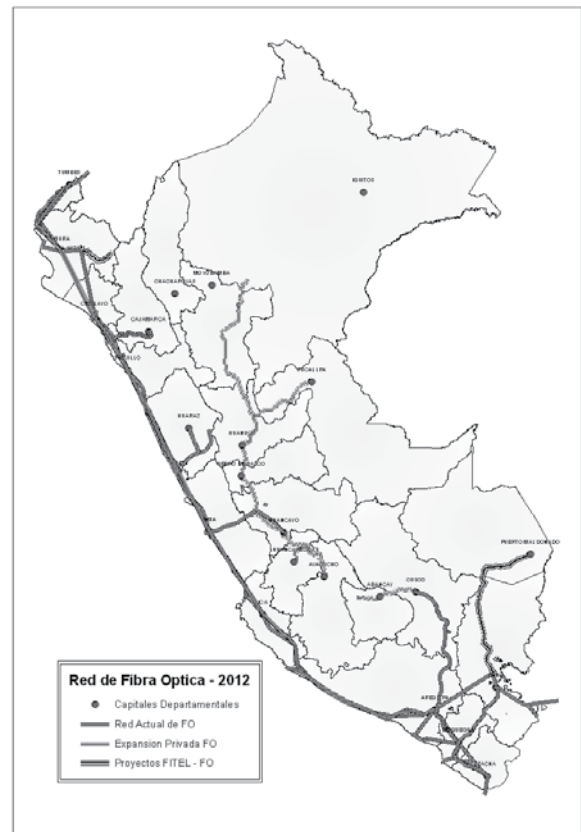
Figura N° 1: Redes de transporte de fibra óptica en el país

Las redes de transporte son redes que interconectan el país y permiten el transporte de grandes cantidades de información. Como se mencionó anteriormente, el mayor componente de costos en redes de fibra son las obras civiles que se requieren: ductos y postes. En el Perú, las redes de transporte son subterráneas y aéreas (usando infraestructura de las empresas de transmisión de electricidad).