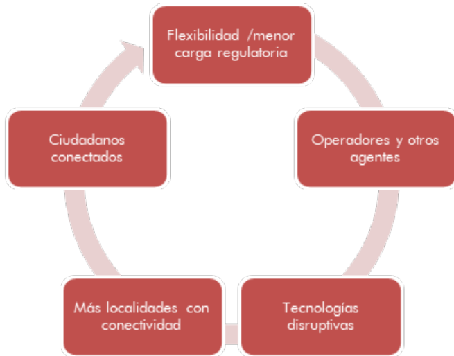
Gráfico 3. Círculo virtuoso de conectividad en zonas con limitada o nula conectividad