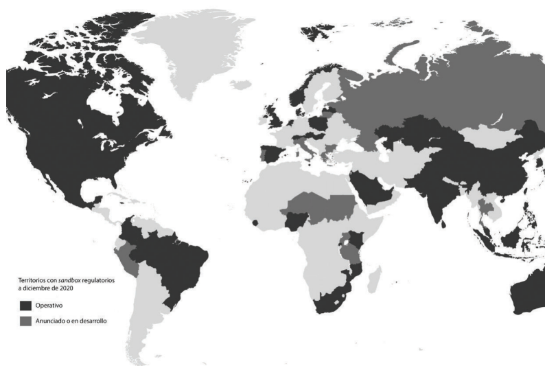
Gráfico N° 1. Mapa de territorios con sandbox a diciembre de 2020