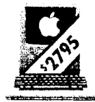
Apple Mac 512**