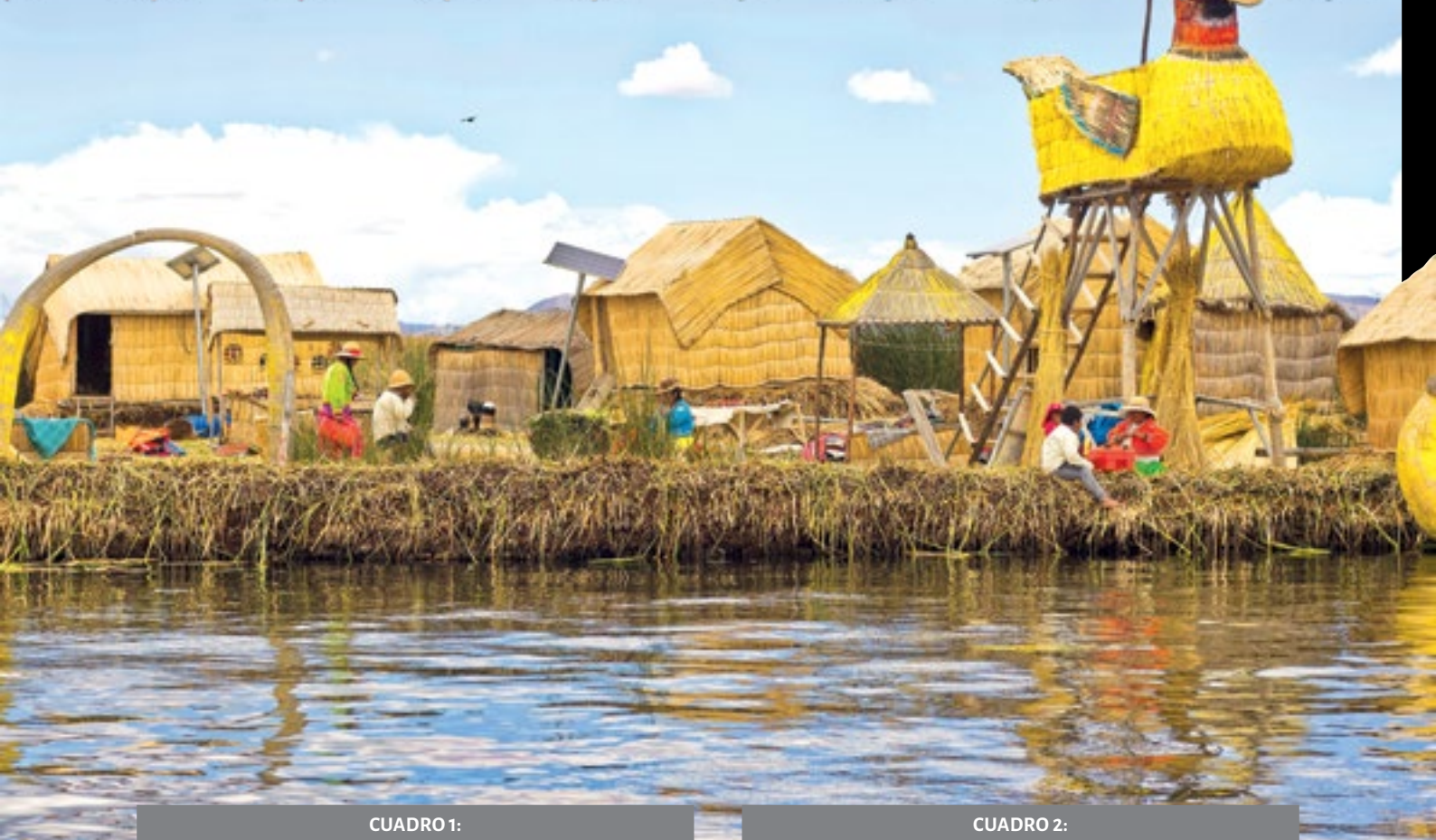
CUADRO 1: ODS 3: INCIDENCIA DE TBC, MALARIA Y HEPATITIS B (POR CIENTO MIL HABITANTES)