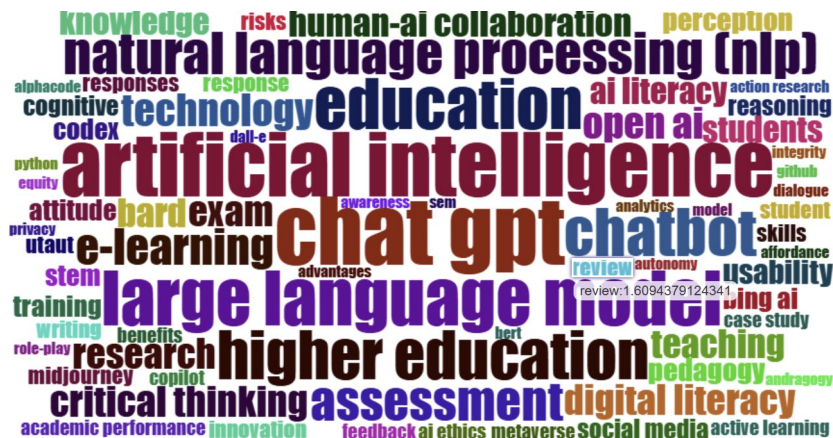
Figura 3. Nuvem de palavras

Nota. Análise bibliométrica na formatação de nuvem de palavras, por meio da ferramenta do Bibliometrix