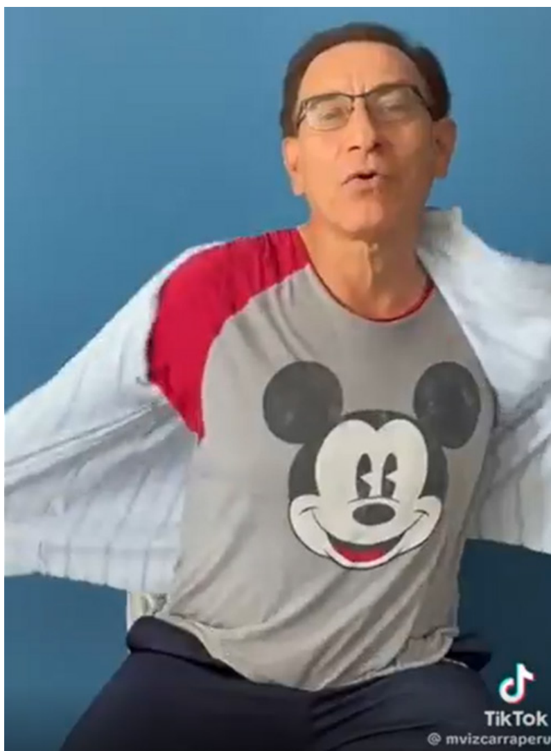
Figura 5.

Sobre el análisis de la multimodalidad en la data presentada, resulta importante mencionar que los aspectos no verbales también son importantes dentro del análisis del discurso ya que la elección de ciertos movimientos o selecciones semióticas codifica otros significados que pueden relacionarse al apoyo o rechazo de lo que se expresa verbalmente (Machin et al. 2016: 304). A partir de ello, se identifica un recurso clave utilizado por Martín Vizcarra en su video: el pijama de Mickey Mouse que procede a mostrar después de quitarse la camisa al mismo tiempo de enunciar “me encontraron en pijama” (05).