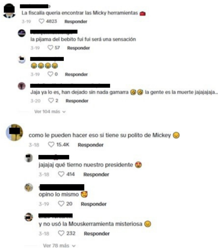
Figura 6. Origen: Comentarios en el TikTok original de Martín Vizcarra (captura de pantalla de la autora).

En este contexto se hace evidente la intención del expresidente de dirigir la atención hacia la broma para que pase a segundo plano el hecho de que su vivienda fue allanada en el marco de una investigación por presuntos delitos cometidos durante su gestión pública. De esta manera, emplea un recurso semiótico a su favor, convirtiéndolo en una cortina de humo destinada a restar gravedad al proceso en el que se encuentra involucrado. Esta estrategia demuestra ser eficaz, pues en los comentarios del TikTok predominan expresiones de apoyo y alusiones humorísticas al personaje: “cómo le pueden hacer eso si tiene su polito de Mickey”; “y no usó la Mouskerramienta misteriosa”; y “La fiscalía quería encontrar las Micky herramientas”.