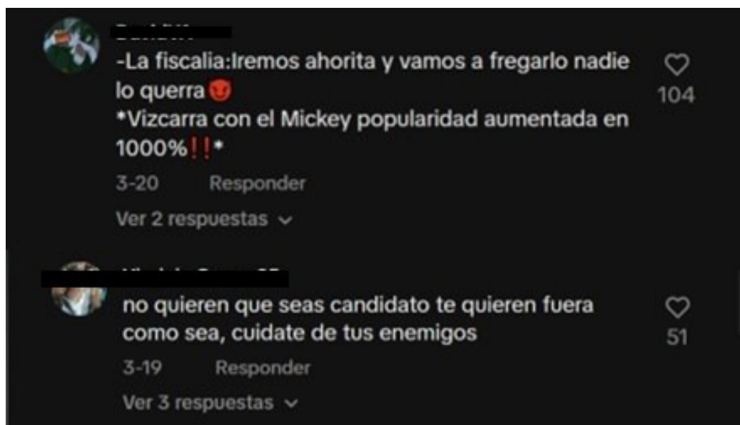
Figura 4. Origen: Comentarios en el TikTok original de Martín Vizcarra (captura de pantalla de la autora).

Otro caso en el que hay una clara inclusión del actor social lo encontramos en 15, donde Vizcarra manifiesta que “muchacha gente lo quiere”. Aquí identificamos una personificación que resulta necesaria para hacer énfasis en la existencia de un grupo humano que lo respalda. No obstante, no los define ni colectiviza dentro de un grupo, lo cual implica la existencia del uso de la indeterminación. Esta consiste en la representación de el o los actores sociales sin especificar a través de una colectivización: usualmente se utilizan pronombres indefinidos, como “muchacha”, en este caso (Van Leeuwen 1997: 51). Esto es aplicado por el expresidente para referirse a la población en general y no únicamente a quienes respaldan sus ideas políticas, lo cual implicaría perder ese sentimiento de empatía que busca inspirar en el público.