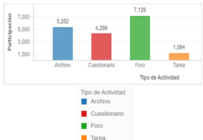
Gráfico 1: Estadística brindada por la plataforma PAIDEIA en relación a la participación de los(as) estudiantes en cada actividad realizada

Las estadísticas brindadas por Paideia – principal plataforma virtual utilizada en la PUCP para el mejor desarrollo de los cursos– muestran que la actividad con mayor nivel de participaciones en el curso fue la de los foros de preguntas y respuestas, tal como se muestra en el Gráfico 1. Esto nos permitió ver en esta estrategia una manera de hacer frente a una de las preguntas que nos formulamos al inicio de semestre: ¿cómo logramos mantener la interacción entre nuestro/as estudiantes?