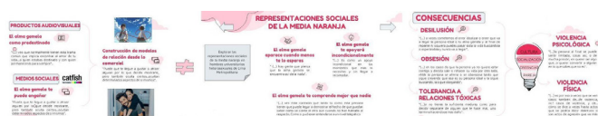
Gráfico 1: Diagrama integrador de Investigación “Mitos del amor romántico y representaciones sociales en hombres universitarios heterosexuales de Lima Metropolitana” - Semestre 2020-2