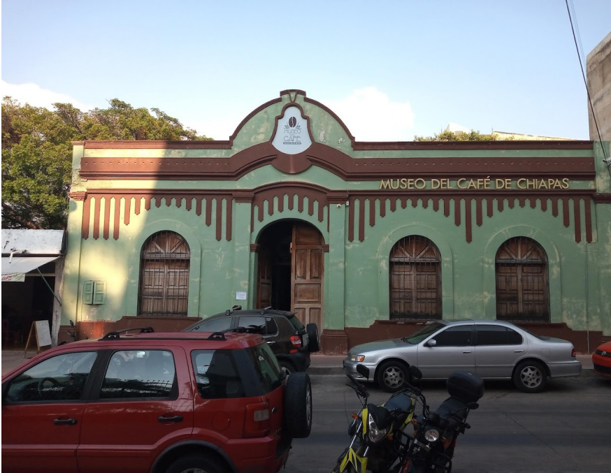
► Figura 3 Fachada del Museo del Café. Izquierda: vista so- bre la calle 2.a Oriente, 2020; centro: detalles de la fachada, 2023; dere- cha: ventana, 2023.