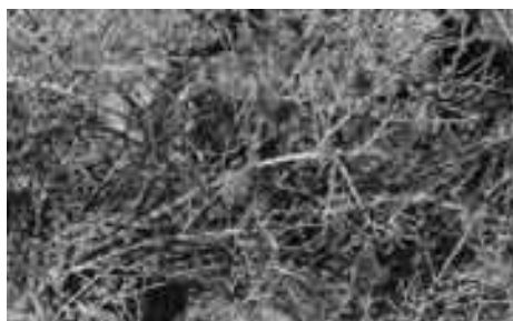
Foto 7. Ambrosia fruticosa