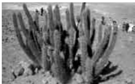
Foto 5. Haageocereus