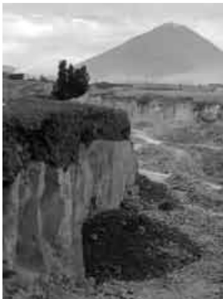
Foto 2. La quebrada de Añashuayco y la ignimbrita blanca, «sillar»