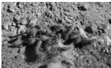
Foto 4. Corryocactus peruvianus

Asimismo, existe una interrelación entre el elemento hidrósfera con la biósfera. El manantial San Jacinto provee de agua para la existencia abundante de la vegetación del lugar, que es aprovechada por el hombre como recurso natural como en la construcción de viviendas de carrizo.