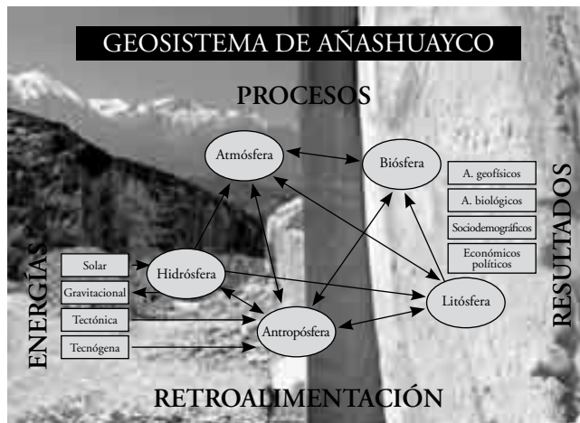
Figura 1. Localización del geosistema de la quebrada de Añashuayco

La quebrada de Añashuayco se extiende a lo largo de la penillanura de Arequipa, nace de la confluencia de tres quebradas cerca al puente de Añashuayco, camino a Yura y muy cerca al Aeropuerto Rodríguez Ballón, desembocando en el río Chili muy cerca al peaje de Uchumayo.