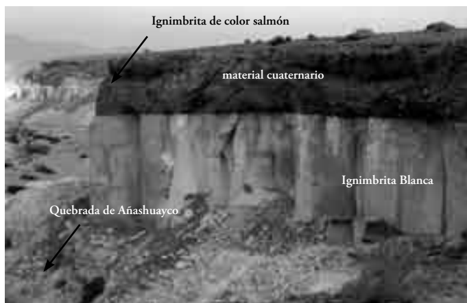
Foto 3. Quebrada de Añashuayco: Se observa la ignimbrita blanca, la ignimbrita de color salmón y sobreyaciendo a estas se aprecia los materiales aluviales del Cuaternario

Las ignimbritas de color salmón tienen una conductividad hidráulica de 5,65 \times 10^{-10} cm/s actúa en muchos lugares como un acuífero de permeabilidad baja, una característica es que estas formaciones presentan la napa freática siguiendo en forma muy aproximada la topografía, como se ha registrado en la zona, la profundidad de la misma llega a más de los 80 metros.