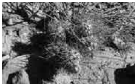
Foto 6. Opuntia corotilla