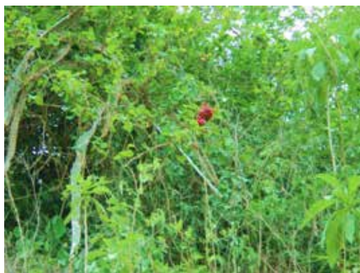
Figura 1. Pitaya vista desde la parte inferior (a) y superior (b)

El binomio como tal (es decir, Hylocereus peruvianus ) ha sido utilizado en la literatura científica (Nyffeler, 2002) y no hay razones nomenclaturales que lo impidan. Cabe mencionar que la taxonomía de las especies en este género está en constante fluctuación por la naturaleza biológica de las especies (la mayoría de las especies de Hylocereus son similares en tallo y flor) y su correspondiente circunscripción (Cáliz, 2005, p. 11), la cual ha eludido los especialistas hasta la fecha. Finalmente, cabe aclarar que en el presente estudio se usa el nombre «pitaya» para referirse tanto a la planta en sí como al fruto comercial.