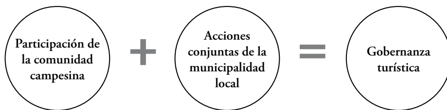
Figura 4. Componentes de la gobernanza turística en Lachaqui