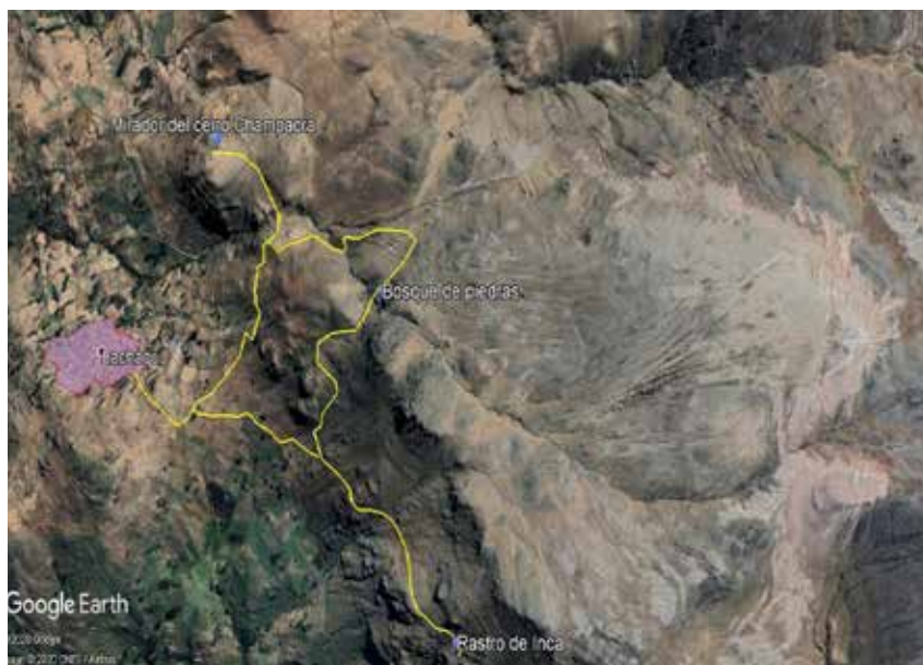
Figura 3. Mapa de ruta turística de Lachaqui en Google Earth