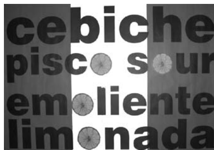
Figura 2. Poster de El Colectivo: La bandera peruana con cuatro platos típicos de importancia nacional, la letra «o» es reemplazado por el limón

Uno de los carteles de El Colectivo enumera cuatro platos importantes con la letra «o», substituida por los limones en un fondo de la bandera peruana (véase la figura 2). No hay incluso una referencia a Tambogrande en el cartel, en él está subrayada la importancia del limón para la identidad nacional. La estrategia confía en la narrativización eficaz de Tambogrande como el productor principal de limón, para alcanzar firmemente a la audiencia. La línea de asociación que conecta estos dos se implica: Tambogrande igual a limón, y el limón igual a Perú. Por lo tanto Tambogrande igual a Perú. El luchar contra el proyecto de Manhattan es estar luchando a favor de la identidad peruana.