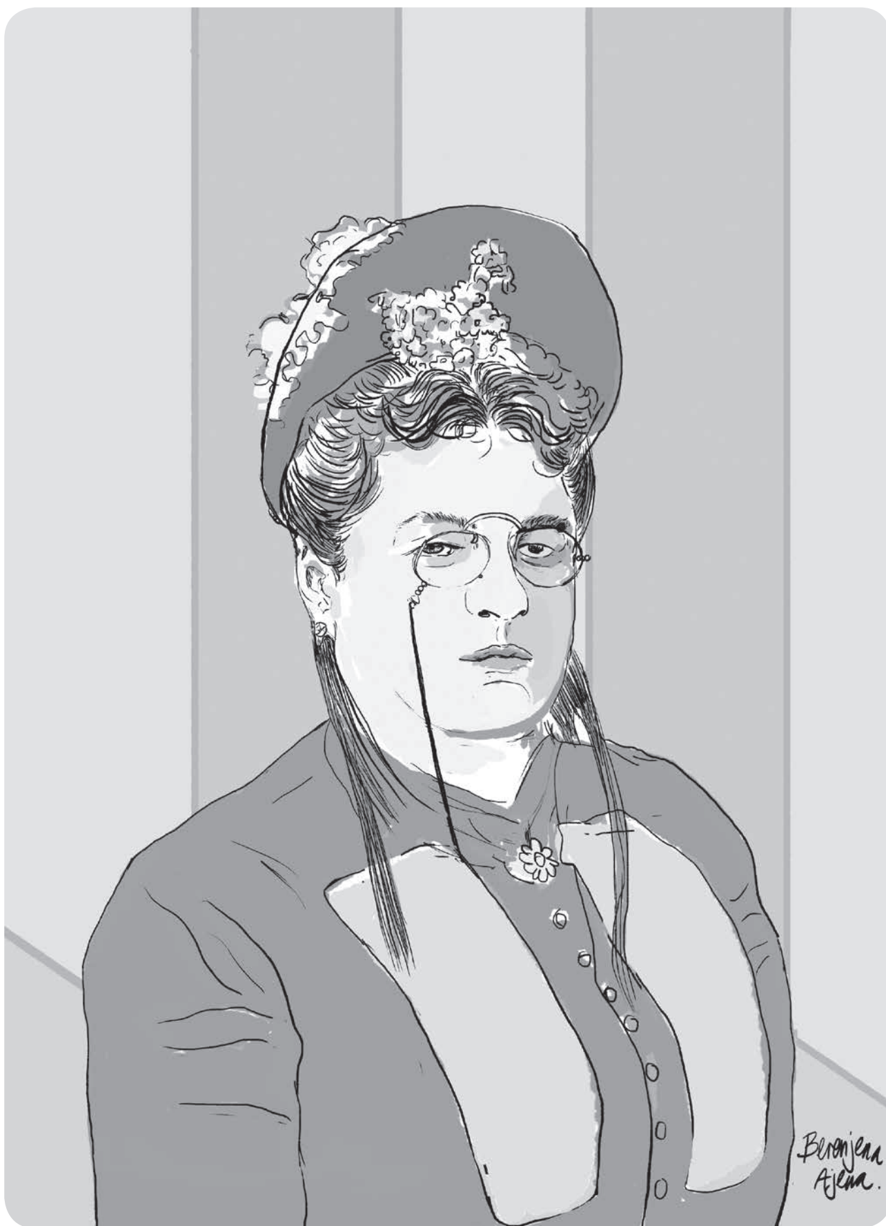
Clorinda Matto de Turner. Ilustración de Berenice Zagastizábal.