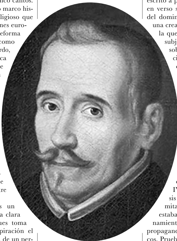
Lope de Vega. Óleo atribuido a Eugenio Cajés en el Museo Lázaro Galdiano, Madrid.

Por lo tanto, podemos afirmar que la épica renacentista, que camina entre la historia y