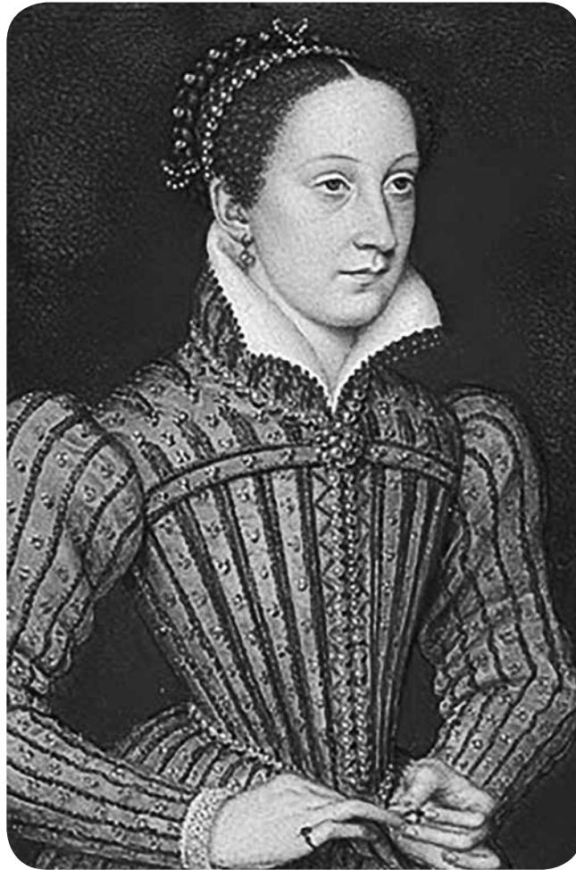
María Estuardo, reina de Escocia. Retrato de François Clouet.

medio del caos político en el que está sumido el país. La heroína, por su parte, no ha podido mantener la unidad del pueblo y ha perdido el liderazgo de su comunidad. Ya no representa más al país que gobierna y se extingue en ella ese poder del que deben estar revestidos los reyes y prin-