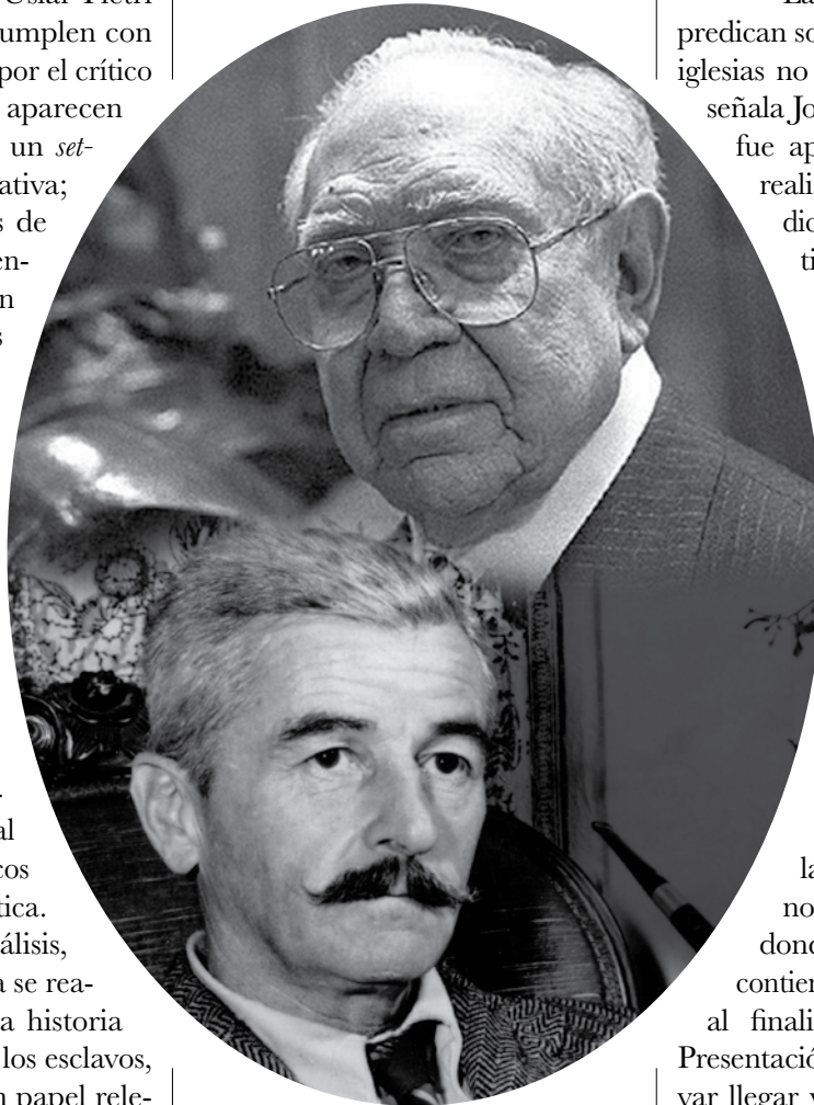
Arturo Uslar Pietri y William Faulkner.

Las lanzas coloradas es una novela pródiga en el uso de marcas históricas y contextuales. Por ejemplo, se menciona el terremoto de 1812: “El jueves Santo, 26 de marzo de 1812, a las cuatro y siete minutos de la tarde, a lo largo del sistema de montañas que va desde la costa hasta los Andes, toda la tierra se sacudió y tembló profundamente”