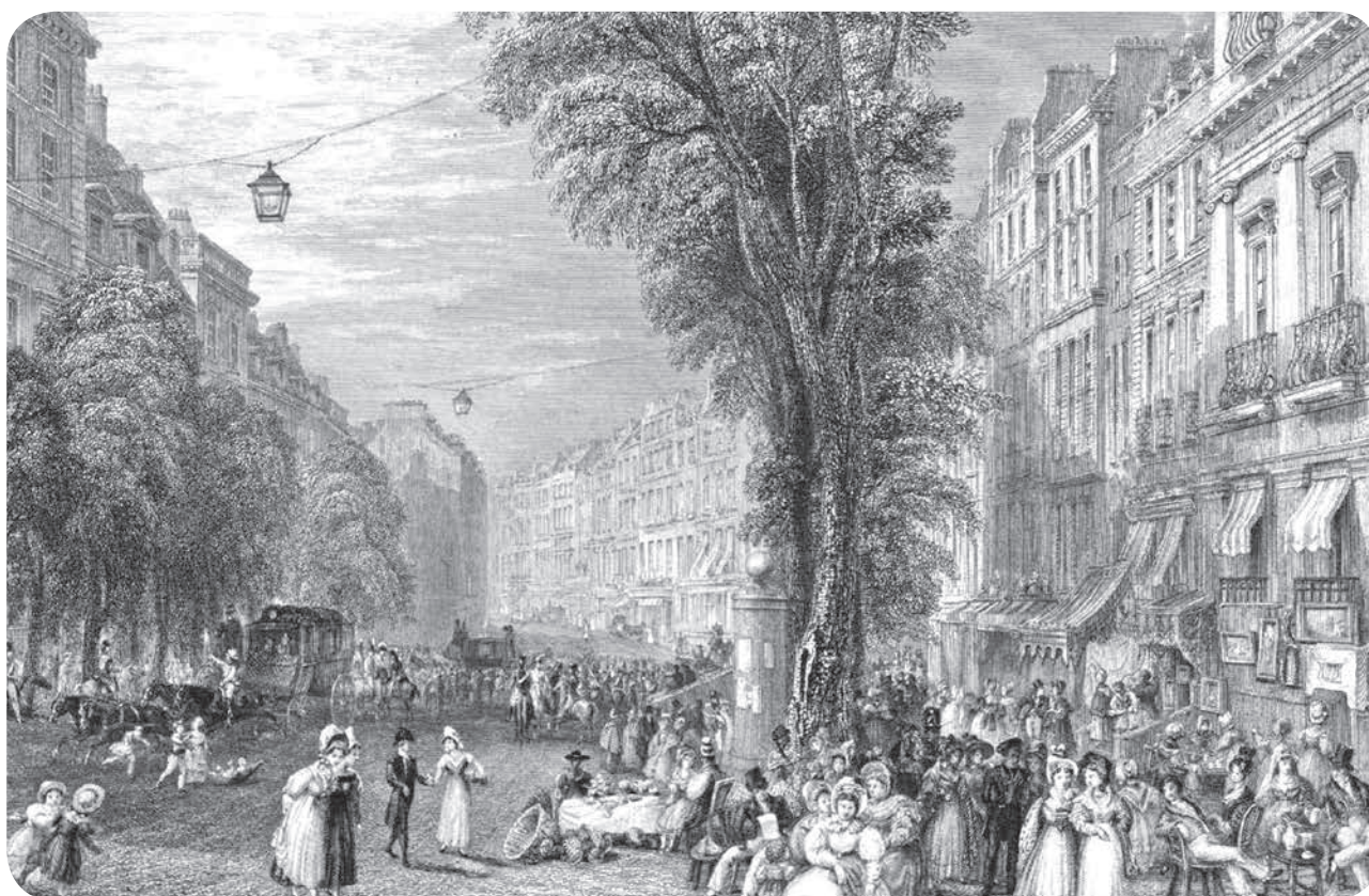
París en 1840. Ilustración de Joseph Mallord William Turner.