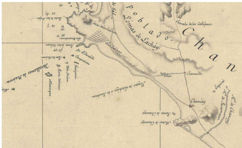
Figura 1. Detalle de la Carta de las costas desde el Callao hasta Santa en el Reyno del Perú (1819) de Andrés Baleato en el que figuran las «Colcas» del Inca situadas al oeste de Chancayllo (MN, Signatura 35-A-2).

Esta técnica de almacenamiento, practicada en la costa peruana desde aproximadamente los años 1800 a 1500 a.C., correspondientes al período Precerámico VI, 96 parece haber sido ampliamente utilizada en el valle de Chancay y territorios comarcanos, 97 incluso en tiempos coloniales, no solo entre la población indígena, sino también por los propios españoles, como puede observarse en una carta de venta redactada el 27 de noviembre de 1597 con la que Pedro Balaguer de Salcedo vende a Juan de Lara mil quinientas fanegas de maíz «bueno, limpio y seco... de la cosecha deste presente año puesto en la costa, que tubo Juan de Mendoza... en my chacara nombrada Caqui en termyno de Chancay [en Aucallama] y cubierto con arena bien tapado». 98