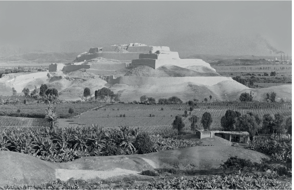
Figura 3. Vista del templo solar inca de Paramonga y su entorno agrícola aledaño. Fotografía tomada en 1950 por el geógrafo catalán Gonzalo de Reparaz Ruiz (Institut Cartogràfic i Geològic de Catalunya, Fons Reparaz, RF. 49813).