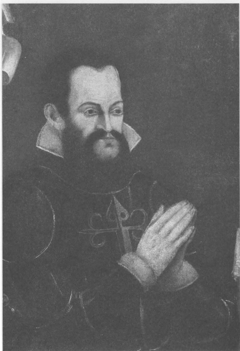
4. Retrato de Antonio de Ribera. Detalle.