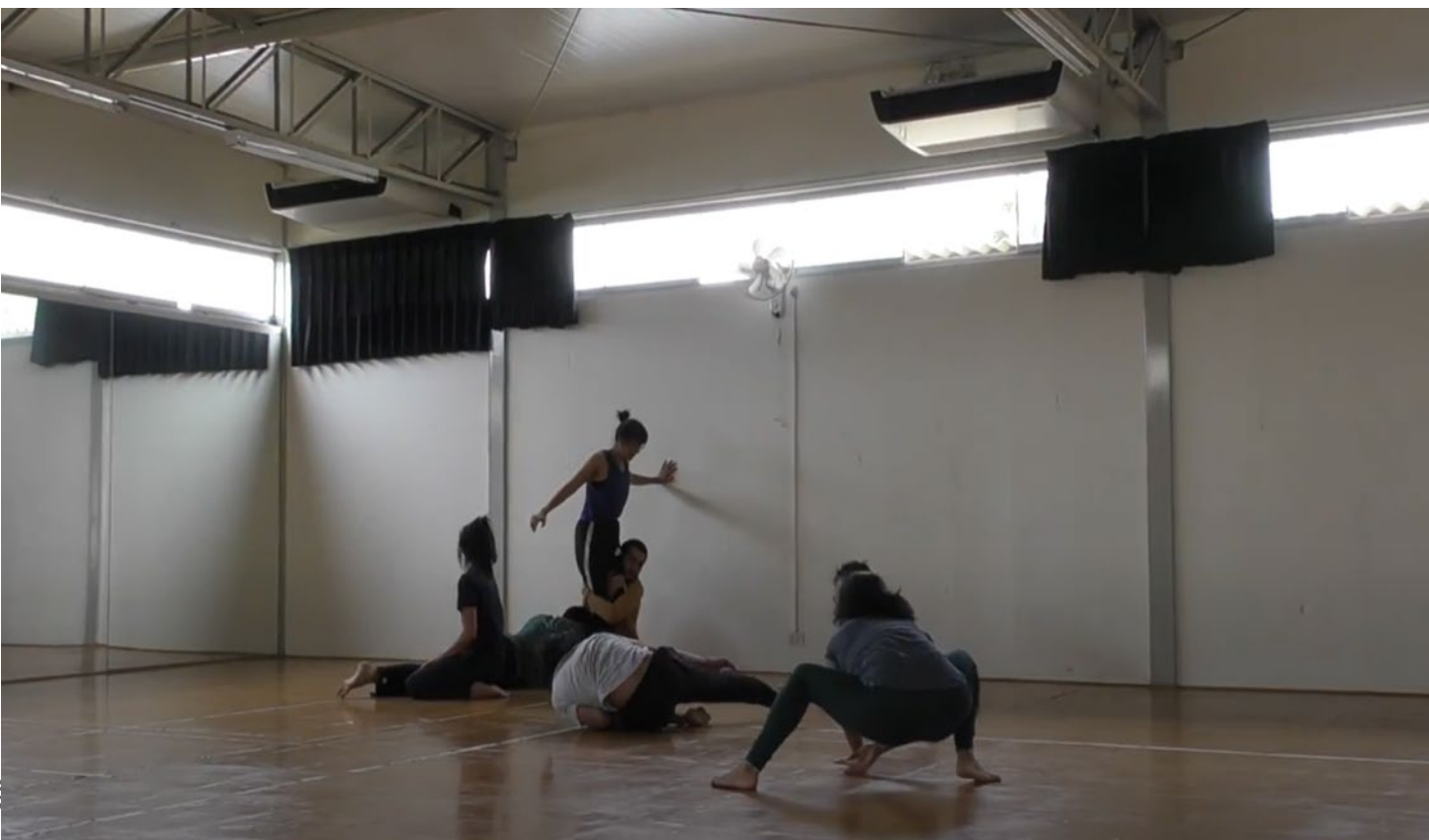
▲ Figura 1 - Dinámica Sigue el Sol.

emergiendo como un nuevo Sol— demostraban el poder del “toque” 5 como fuente para crear historias.