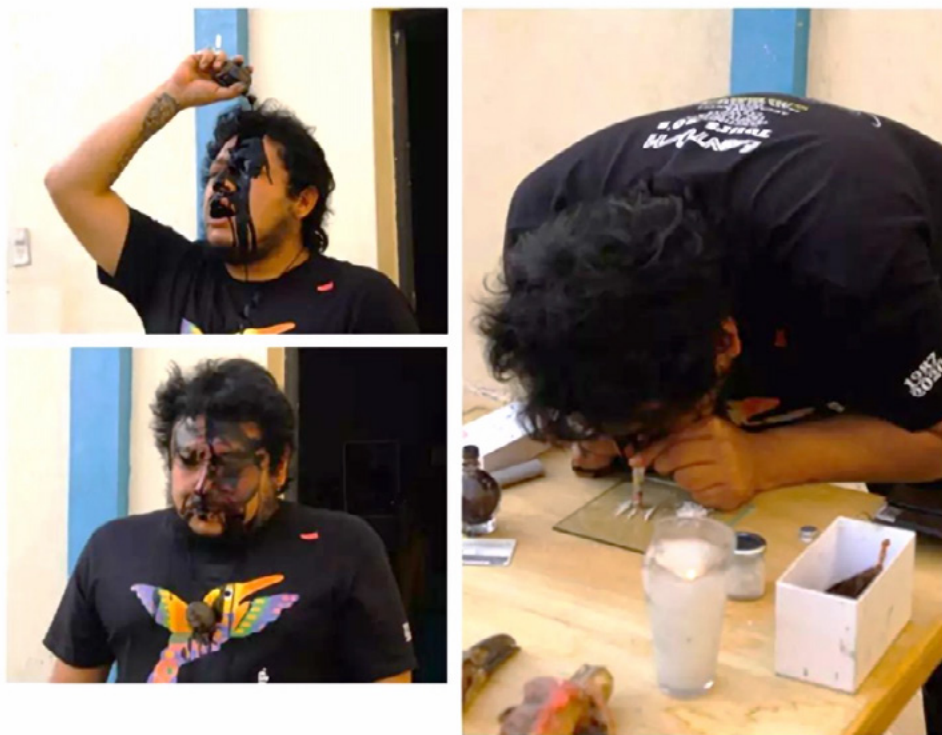
▲ Figura 5. Acción inhalativa en 2º Encuentro Internacional de Performance “No Lo Haga Usted Mismo”, 2020