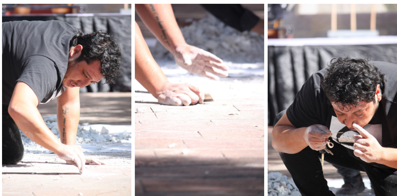
▲ Figura 4. Inhalación de escultura de yeso en Plaza Jesús F. Conteras, 5° Encuentro Internacional de Performance “No Lo Haga Usted Mismo”, 2023