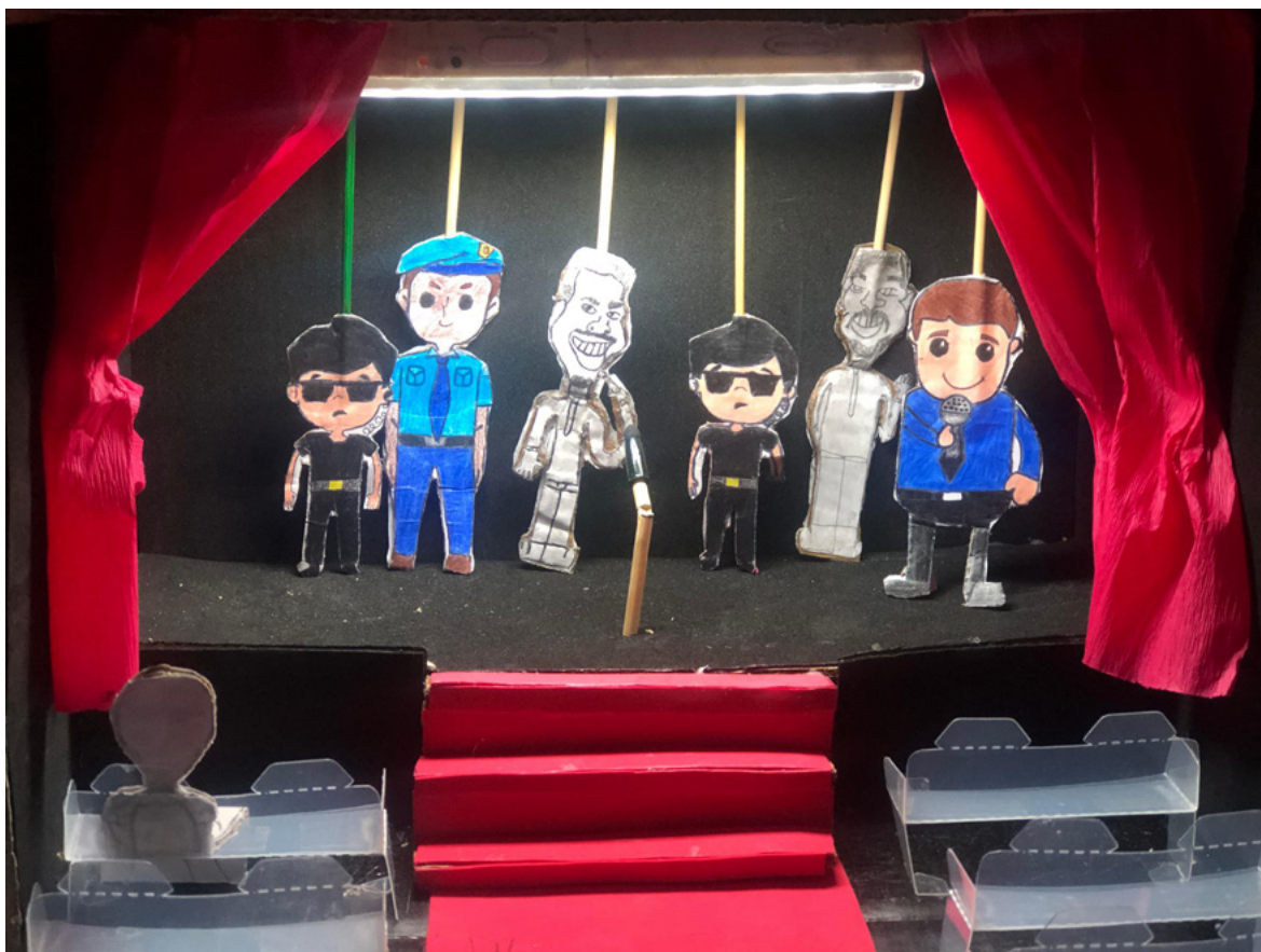
▲ Figura 1. Práctica pedagógica con teatro de títeres de papel

De igual manera, Gaiger destaca que la enseñanza del teatro en la escuela “es un proceso de educación y formación humana que acentúa el potencial humanístico, impulsando una conciencia estética, crítica, ética y solidaria” (2019, p. 43). También afirma que la presencia del teatro en la escuela es capaz de mostrar a los estudiantes la existencia de otras realidades y cómo las modificamos a través de las experiencias estéticas.