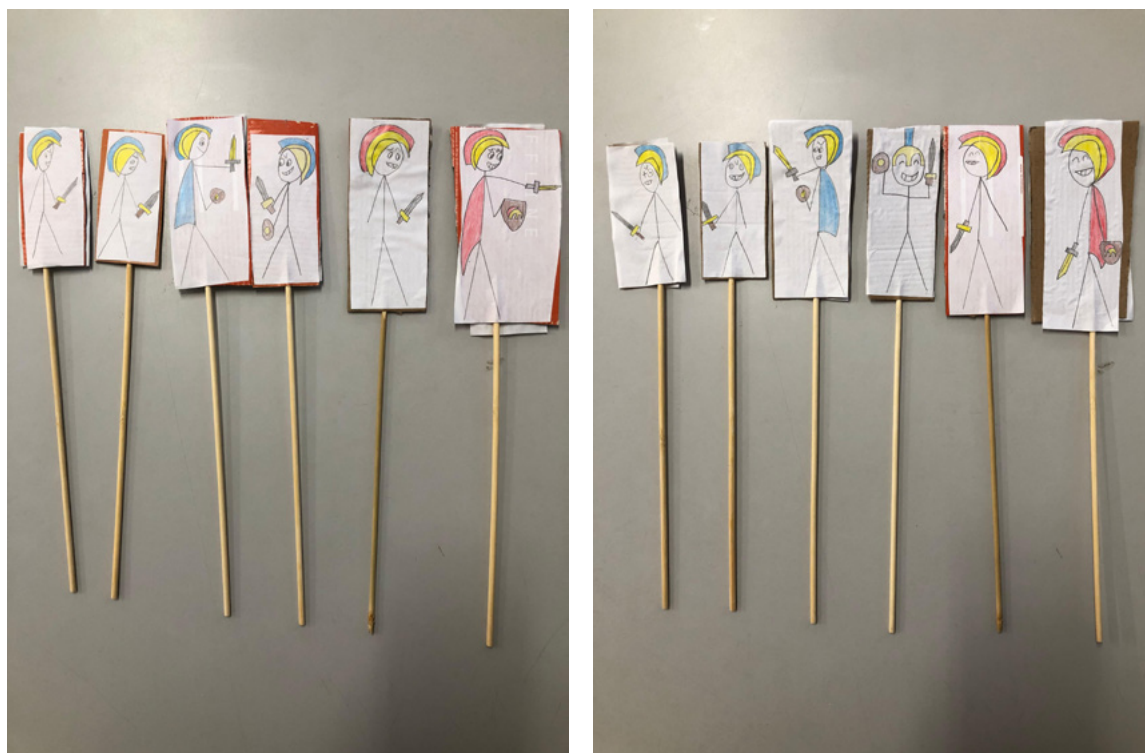
▲ Figura 3. Anverso y reverso del personaje del teatro de títeres de papel