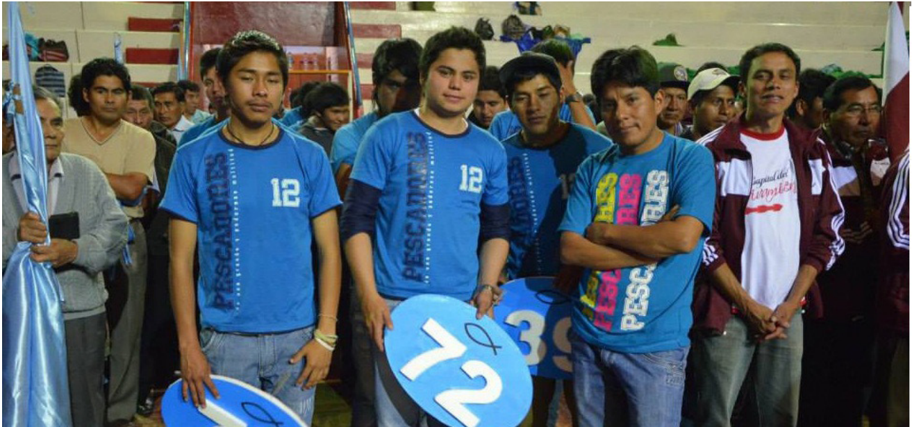
Figura 2. Las células. Por Iglesia Primera Asamblea (2014)..

Consolidar , este es el proceso de afirmar al nuevo convertido en la fe, adoctrinarlo, enseñarle el camino, sacar toda duda que él tenga.