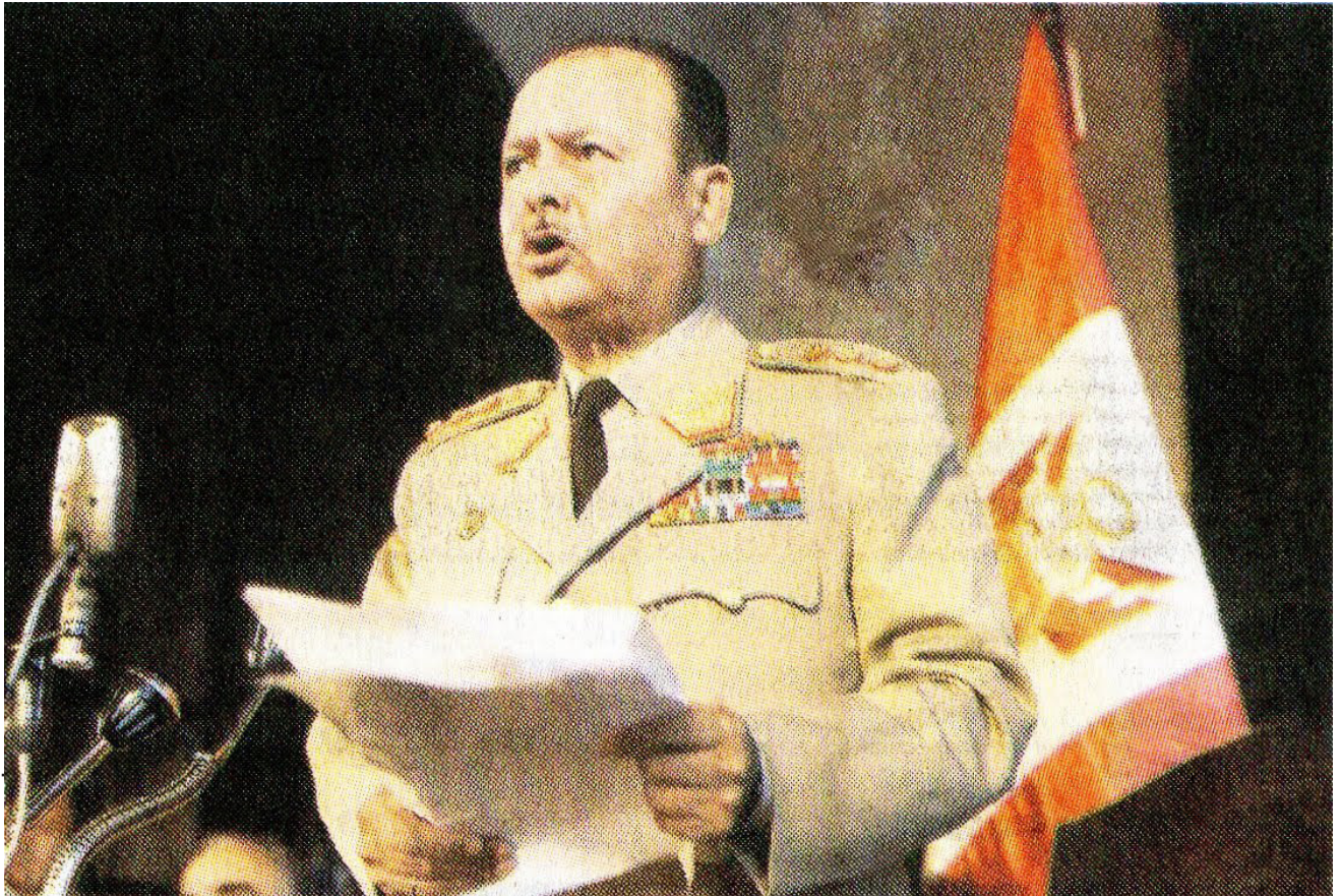
Figura 1. Juan Velasco Alvarado. ADEPRIN (2017)

Frente a la prohibición de los métodos anticonceptivos, no existían grupos sociales organizados que puedan oponerse. Cabe resaltar que durante este primer periodo, de las primeras luces de la planificación familiar, existieron tres actores sociales perenes en la arena social: las feministas, quienes estaban a favor; los médicos, quienes se dividían en dos grupos: a favor y en contra; y la Iglesia, quien también se dividió en dos grupos: a favor y en contra.