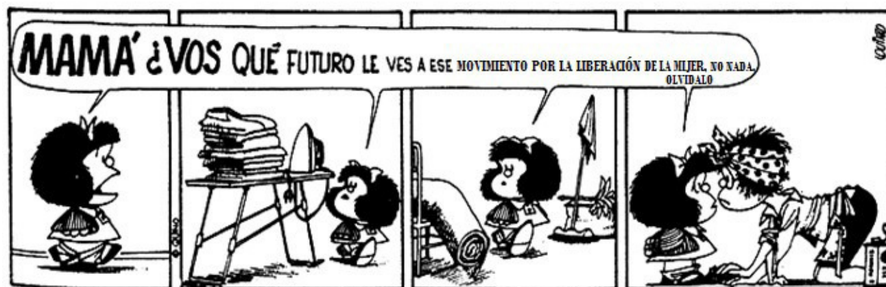
Figura 2. Mafalda, la feminista. Revista Petra (2017)

denominaron a su organización Movimiento de Promoción de la Mujer, Grupo de Trabajo Flora Tristán. “Este grupo estaba conformado por mujeres de clase media y alta quienes discutían temas en torno al rol de la mujer como el de la sexualidad, Sin embargo, ellas jamás hicieron o tuvieron acciones políticas como fue el caso de ALIMUPER” (Entrevista a Orvig: 2016)