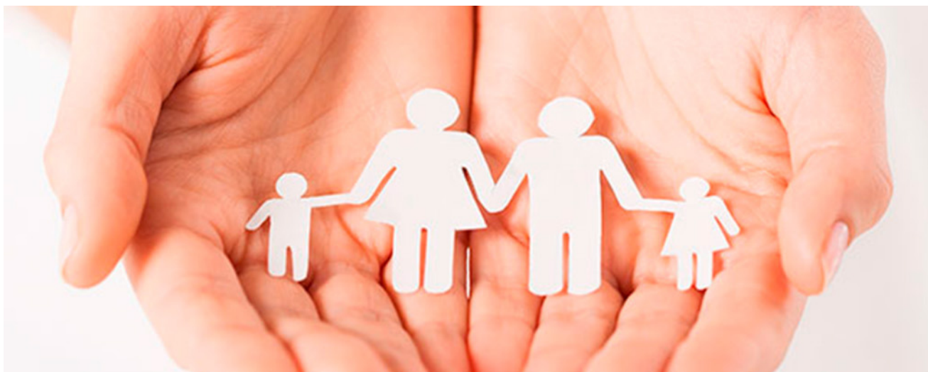
Figura 3. Planificación Familiar. Medica Center Fem (2016)

El trabajo de los especialistas durante el gobierno de Velasco tuvo varias trabas y distintas dificultades debido a su clara oposición del gobierno a la planificación familiar. Se dio un gran retroceso en las distintas instituciones y en la distribución de la información; pero el personal especializado luchó por continuar brindando los servicios de planificación.