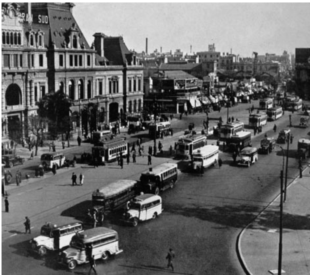
Arriba, la Plaza Constitución en 1936