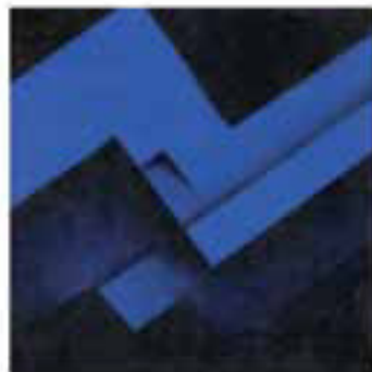
PODER Y AUTORIDAD EN LOS ANDES

Las propuestas de difusión global con contenidos de identidad cultural local son, hoy en día, no sólo oportunas sino también necesarias. La integración de cada cultura en el gran diálogo intercultural del reconocimiento y la circulación de los valores representativos de cada espacio es parte del proyecto humanista de intercambios de valores a partir de su conocimiento e interacción con el público.