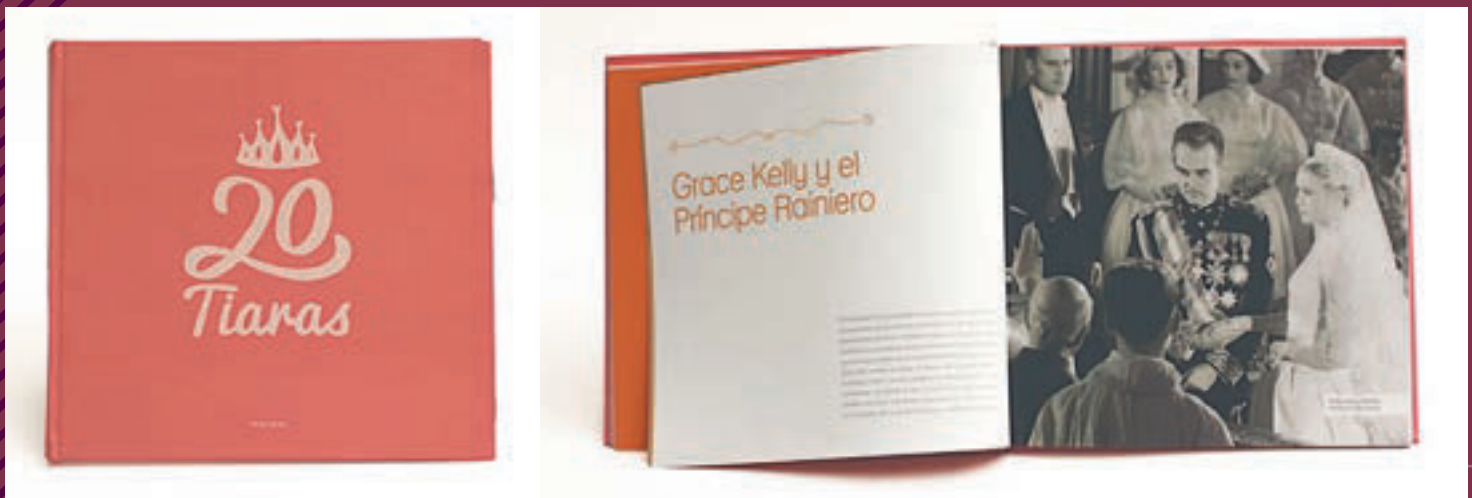
03 20 TIARAS: CRISTINA FRISANCHO, ALEJANDRA CISNEROS Y MICAELA MENESES